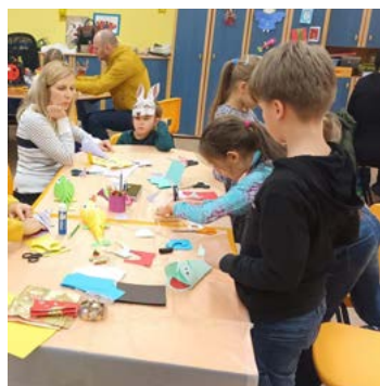
Vánoční tvoření ve školní družině.

Čtvrtek 8. prosince jsme si skutečně užili. Sešli jsme se v družince na pracovišti Boženy Němcové. Přišli děti s rodiči, babičkami i dědečky. K občerstvení jsme pro ně připravili čaj a koláč. Společně jsme vyráběli ozdoby na stromeček, papírová práníčka, papírové andílky, vánoční pohlednice a další výrobky z papíru. Všichni odcházeli spokojeni s haldou výrobků. Atmosféra byla příjemná za zvuku vánočních koled. ZŠ Jeseník