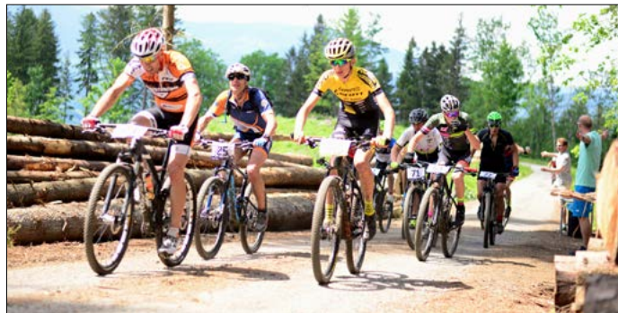
Horská kola jsou dřina, stejně jako jiné sporty. Ale ten pocit, když člověk překoná své hranice, vždy stojí za to.

Hlavní specialitou je to, že se jedná asi o jedinou časovku s hromadným startem. Vloni to byl dokonce závod s nejvyšší účastí na Jesenicku. Proto pro nás nebylo překvapením, že le-