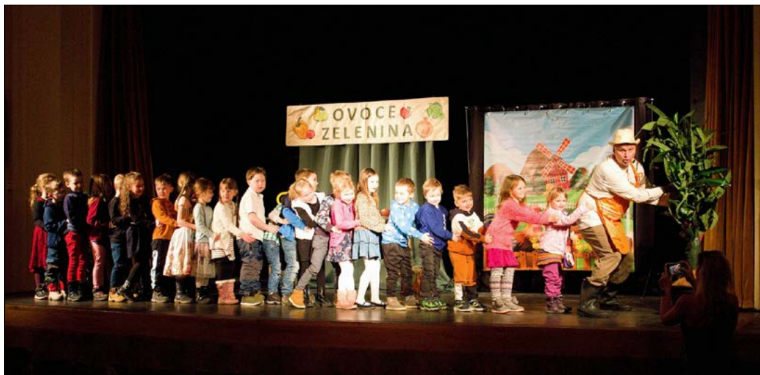
Divadlo Petra Bezruče připravilo pro děti z mateřských a základních škol na 11. dubna jarní pohádku „O kouzelném semínku“. Děti aktivně hlavnímu hrdinovi Jírovi radily, jak se sadí semínko a nakonec si několik odvážlivců zahrálo v pohádce také. Sklidili zaslužený potlesk publika.