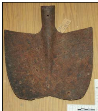
Snímek lopaty, která se nachází ve sbírkách javornického oddělení VMJ.