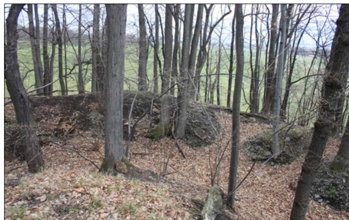
Zákop v Račím údolí, kde byl předmět nalezen.

Hned nato začala nová ofenziva sovětských vojsk proti německým jednotkám ve Slezsku. Proti sobě na našem úseku stanula německá 17. armáda skupiny Střed a ruská 59. armáda 1. ukrajinského frontu (název tohoto frontu neznamená, že sestával jen z vojáků ukrajinské národnosti, národnostní složení jejich řad bylo velmi pestré). Dne 8. února 1945 ruští zajatci budovali v obci Travná obranné postavení, následně je vystřídali příslušní-