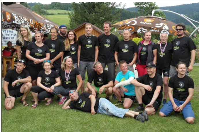
Uspořádat závod jako je Šumná jízda není jen tak. Proto je potřeba široký pořadatelský tým lidí, nejlépe cyklistických nadšenců.