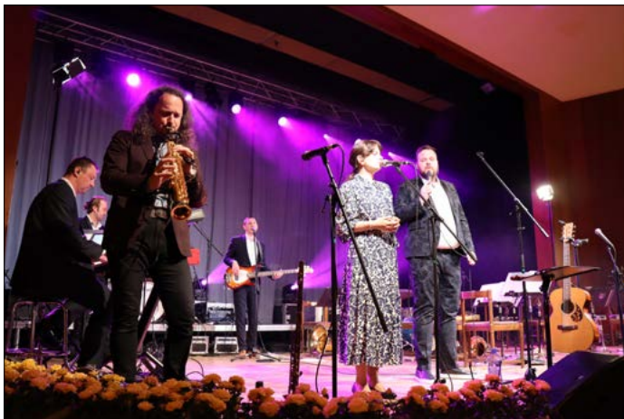
Městský bál. V sobotu 30. dubna se uskutečnil v sále budovy IPOS první ročník Městského bálu. Návštěvníci si mohli po dvou covidem omezených plesových sezonách znovu užít v Jeseníku bohatý kulturní program s tombolou.