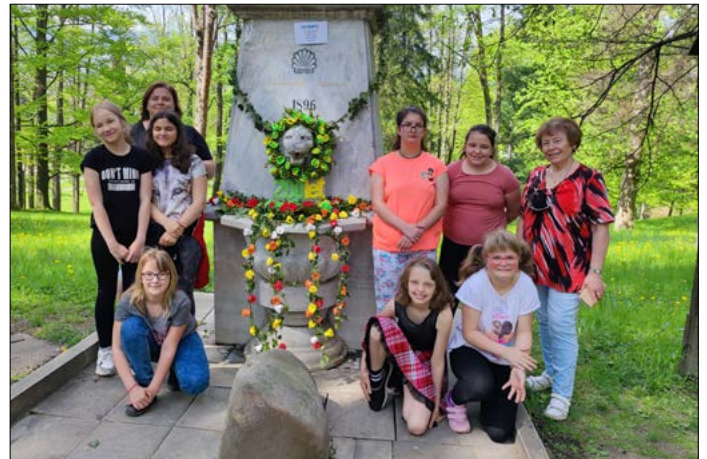
Děti ze ZŠ Jeseník, Fučíkova u Neuburského pramene.