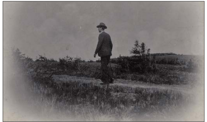
Jeho Výsost arcivévoda stoupá směrem k Jiřího chatě na Šeráku.

Bezmála 300 účastníků se po obědě sešlo na jesenickém nádraží, odkud je speciální vlak dopravil na Ramzovou. Pod vedením Morav-