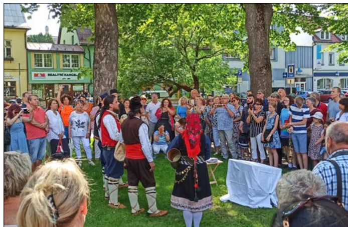
Řecký dudáček a taneční soubor Evros z Javorníku.