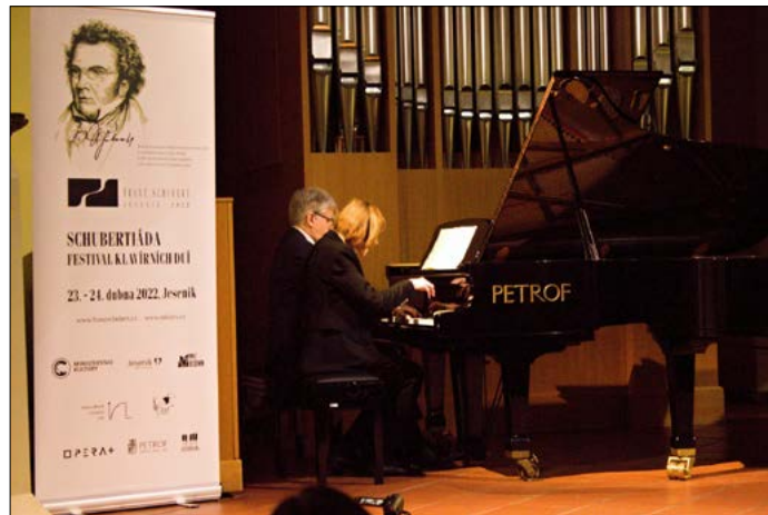
Schubertiáda. Ve dnech 23. a 24. dubna proběhla Schubertiáda jako nesoutěžní festival klavírních dvojic. Příští rok na jaře opět přivítáme Schubertovu soutěž pro klavírní dua, jak jsme již od roku 1978 zvyklí.