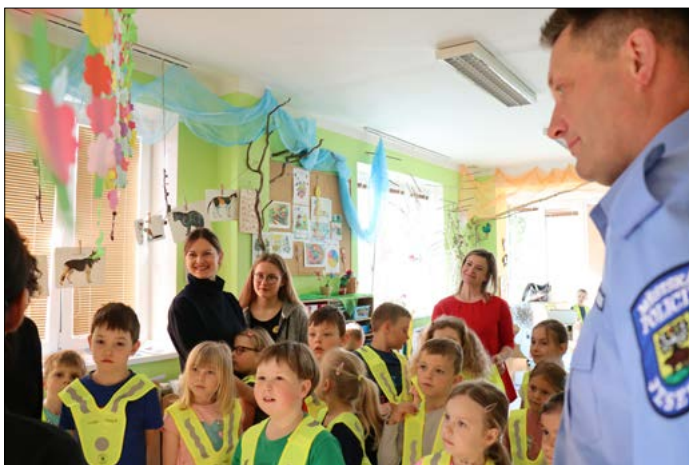
Nové reflexní vestičky. Předškoláci mají nové reflexní vestičky pro bezpečné přecházení, na procházky nebo na výlety. Dostaly je od strážníků Městské policie Jeseník ve spolupráci s Odborem školství, kultury a sportu. Udělaly radost nejen dětem, ale i paním učitelkám, které teď mají vestičky pro všechny děti, nejen pro první a poslední ve skupince. Strážníci postupně navštívili mateřské školky Jiráskova, Křížkovského, Karla Čapka, Tyršova a Dittersdorfova a rozdali více jak sto padesát vestiček. Předali také reflexní předměty, jako např. pásky, klíčenky, přívěšky a omalovánky s dopravní tematikou.