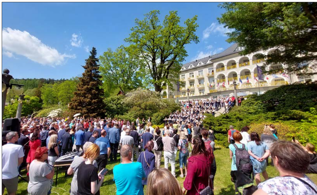
Polovina května opět patřila tradičnímu Zahájení lázeňské sezony. Během čtyřdenního maratónu bohatého programu nechyběl ani Dechový orchestr mladých Jeseník.