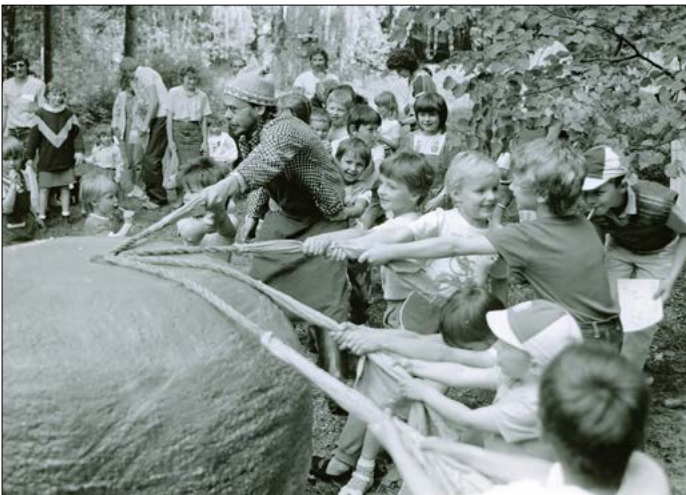
Tahání velké řepy v roce 1990.

Určitě jste všichni z obrázku pochopili, že jde o tahání velké řepy. Byla to derniéra vyhlášené Procházky pohádkovým lesem ve Smetanových sadech. Kdy tato velmi úspěšná a vyhlášená akce pro děti začala? V roce 1981, kdy se podařilo zapojit do této celoměstské akce pro děti, kromě Střediskového kulturního zařízení, místní svazky, dům pionýrů, místní ochotníky a brigády socialistické práce jesenických závodů. Někdy dopoledne, jindy odpoledne nabízel jednotlivá stanoviště v parku dětem zábavu spojenou s plněním různých úkolů. Nechyběly ani koloběžkové závody, vždy však akce vrcholila v letním divadle, kde byl uveden profesionální program, doplněn místními