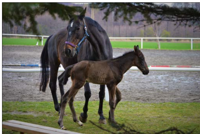
Nový přírůstek v heřmanických stájích.

SŠ gastronomie, farmářství a služeb Jeseník