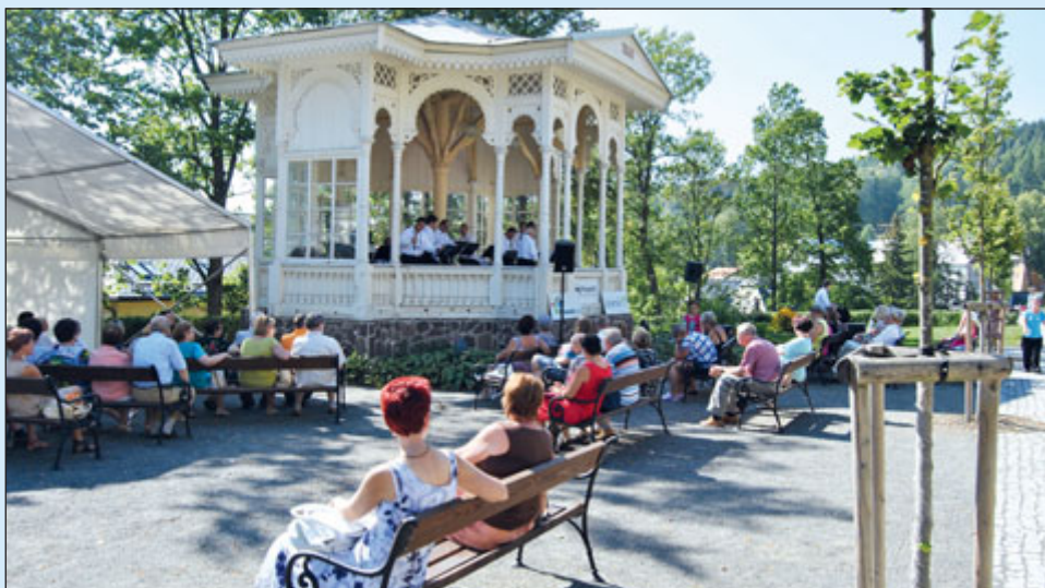
Hudební altán na Ripperově promenádě.