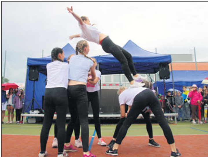
V programu Doškolné vystoupili žáci školy.