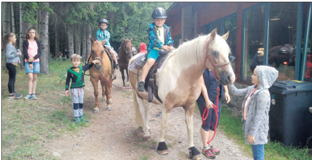
V sedle. Školáci mají za sebou polovinu letních prázdnin a užívají si je na rozličných místech, třeba na táborech SVČ Duha Jeseník.