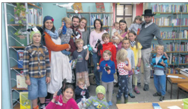
Účastníci veřejného čtení.