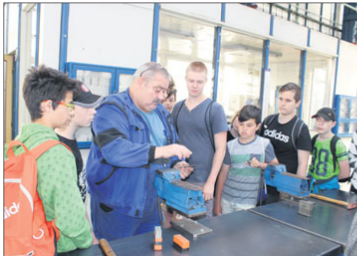
Téměř stovka žáků základních škol z okresu Jeseník se zúčastnila vědomostní a dovednostní soutěže.

Následně si žáci mohli prověřit své čerstvě nabyté poznatky v malém „testíku“. Po absolvování všech stanovišť proběhlo krátce po poledni celkové vyhodnocení