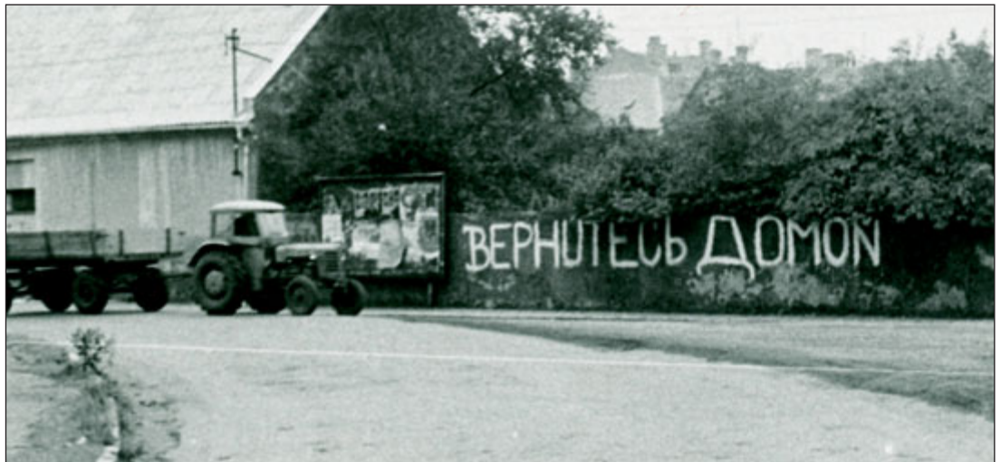
Srpen 1968 v Jeseníku.

Nelze si nepovšimnout , že kronikář naprosto vynechal příčiny, které ke krizi vedly, a jakoby obha-