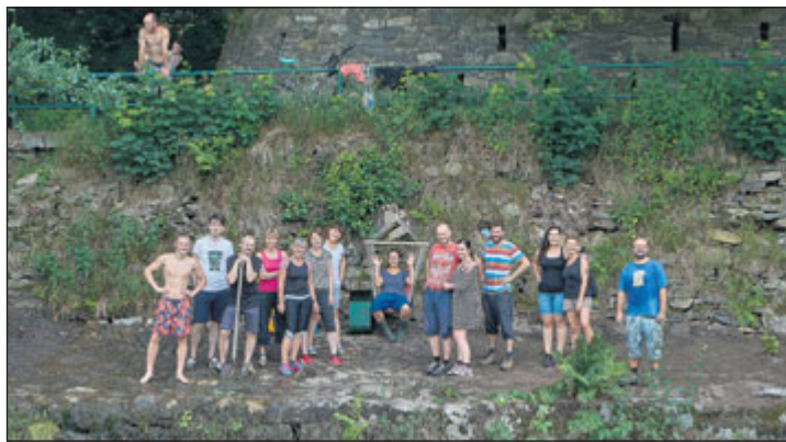
Do úklidu náplavky se pustili dobrovolníci.

Jako první přiložila ruku k dílu skupina dobrovolníků z firmy Saint-Gobain. „V Jeseníku se nám snad podařilo odstartovat přeměnu náplavky řeky Bělé a přijedeme znovu na otvírací večírek,“ řekla jedna z dobrovolnic. Během dalších dvou dobrovolnických akcí bylo vyčištěno cca 70 % plochy náplavky. Další kus práce je potřeba ještě vykonat, proto se hledají další aktivní lidi,