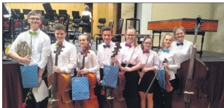
Žáci ZUŠ Jeseník.

Když se pak rozezněly před zcela zaplněným sálem první tóny koncertu Janáčkovy filharmonie dětem, byl to pro všechny hluboký a silný zážitek. Dík za něj patří iniciátorům a organizátorům projektu a také všem žákům a pedagogům zúčastněných ZUŠ, kteří nacvičovali se