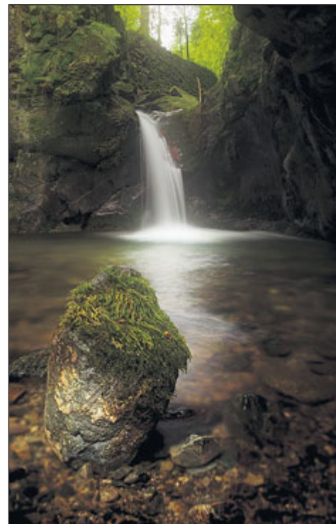
Nýznerovské vodopády. Foto: Radek Leskovjan

Nej snadnější přístup je po lesní cestě z Nýznerova, cesta je vhodná pro pěší i pro cyklisty. Cestou k vodopádu lze o prázdninách každý den mimo neděli navštívit Muzeum Skorošice s exponáty z oblasti regionálních řemesel či geologie. Doplňit energii můžete v Rybářské baště v Nýznerově, která je součástí Rybářství Nýznerov specializovaného na chov pstruha duhového. Bašta je v provozu po dobu letních prázdnin. Zdroj: www.jesenik.org