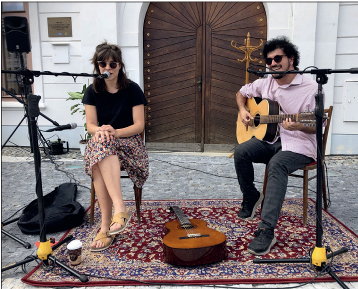
MKZ Jeseník: Letní busking. V pátek 23. července se uskutečnil další letní busking na Masarykově náměstí, tentokrát s pražskou kapelou ONDA WEONIKA.