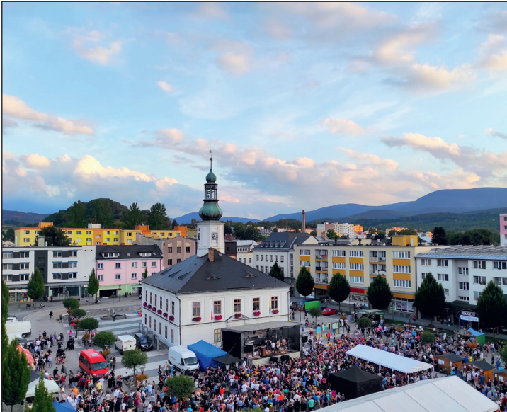
MKZ Jeseník: Jeseník se baví. Vrcholem jeseníckého kulturního léta se jako tradičně stala akce Jeseník se baví, letos propojená s oslavou 30. výročí založení místní firmy Fenix. Hlavní hudební hvězdou večera byla kapela Jelen.