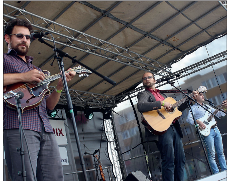
MKZ Jeseník: Jeseník se baví. Mezi účinkujícími na letošním Jeseník se baví nechyběly ani místní kapely. Jednou z nich bylo folkové trio Brejle (na fotografii) a rockové uskupení The Machine.