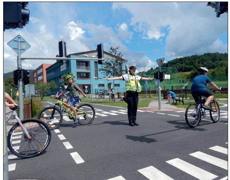
SVČ DUHA Jeseník: Na kole vesele. V červenci proběhl na dětském dopravním hřišti v Jeseníku příměstský tábor s názvem Na kole vesele, plný her a zážitků.