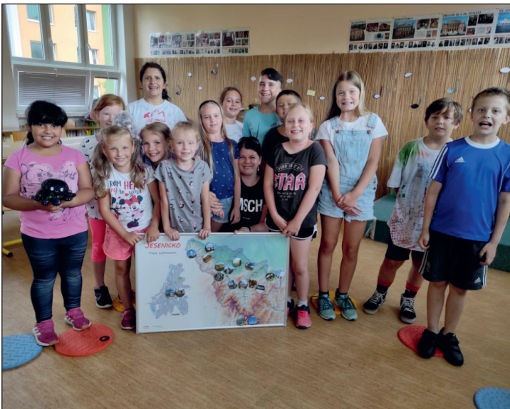
SVČ DUHA Jeseník: Máme rádi Jesenícko. Během letních prázdnin se uskutečnilo sedmnáct letních kempů, které se zaměřily na podporu lokálního patriotismu mezi žáky základních škol z jeseníckého regionu.