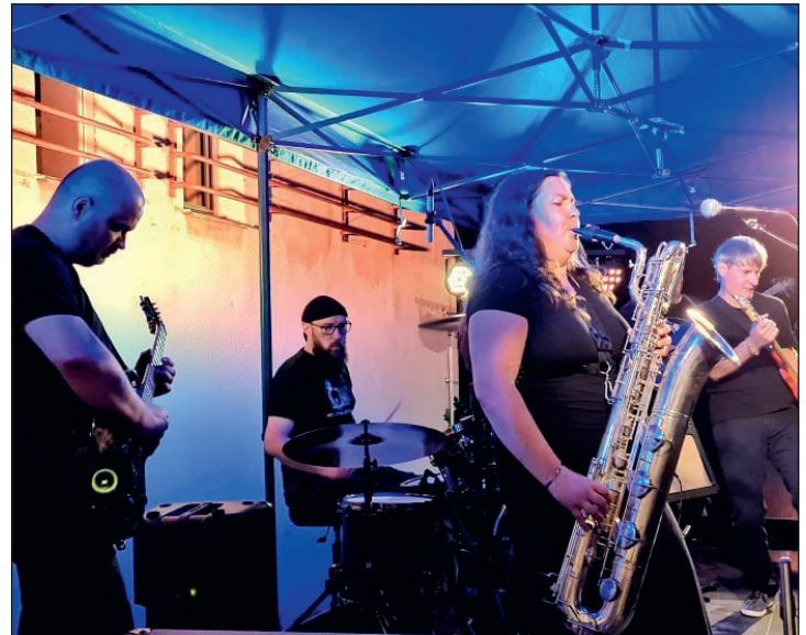
MKZ Jeseník: Noc umění, historie a literatury. Bohatý program, plný přednášek, workshopů, prohlídek a autorského čtení, zakončila místní kapela Zakázané sny.