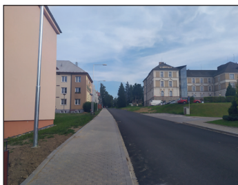
Regenerace sídliště u konce.

Obnova chodníků, cest, zeleně, veřejného osvětlení a dodání nového mobiliáře na sídlišti 9. května jsou hotové. Třetí etapa regenerace tohoto sídliště byla vymezena ulicemi Tylova, U Kasáren a Mahenova.