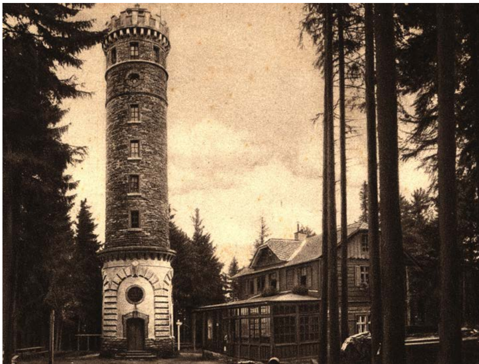
Rozhledna spolu s Medritzerovou chatou.