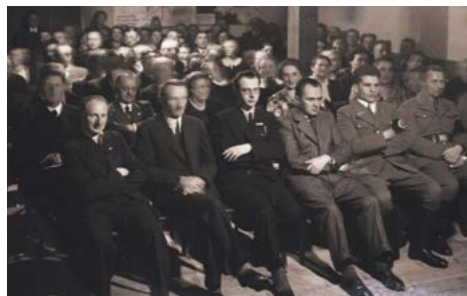
Instruktažní shromáždění členů nacistické strany.

Na přípravě Werwolfu se podílely složky armády, rozvědky, gestapa a jednotek SS. Pro výcvik byli vybíráni především dospívající mladíci, jako instruktoři působili členové vojska i domobrany. Přímo v Jeseníku se budoucí diverzanti školili v Zifferově sanatoriu. Další kurzy probíhaly ve Stříbrnicích, kde se školilo i několik žen. Část frekventantů hovořila polsky, takže zde byli kromě místních zřejmě cvičeni také bojovníci z jazykově smíšených oblastí v Horním Slezsku. Několik center z Jesenicka bylo vysláno do výcvikových center na Opavsku nebo v Kladsku. Politická školení probíhala v osadě Jelení u Holčovic na Krnovsku.