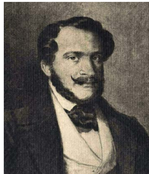
„Kdo oceňuje dobro v druhých, je sám dobrý.“ Miklós Wesselényi.

„Tento velký, moudrý muž stál u kormidla s neochvějným klidem; když plul kolem pevných budov, z jejichž balkónů shlížely bledé tváře panstva, pokynul jim a řekl: Vy ještě můžete počkat, vám velké nebezpečí nehrozí, váš dům bude povodni dlouho odolávat; nejdřív musíme zachránit ty, kteří jsou více ohroženi.“ Když však zahlédl chatrný přízemní domek, z jehož bídné střechy k němu vztahovali ruce zpola oblečení ubožáci,