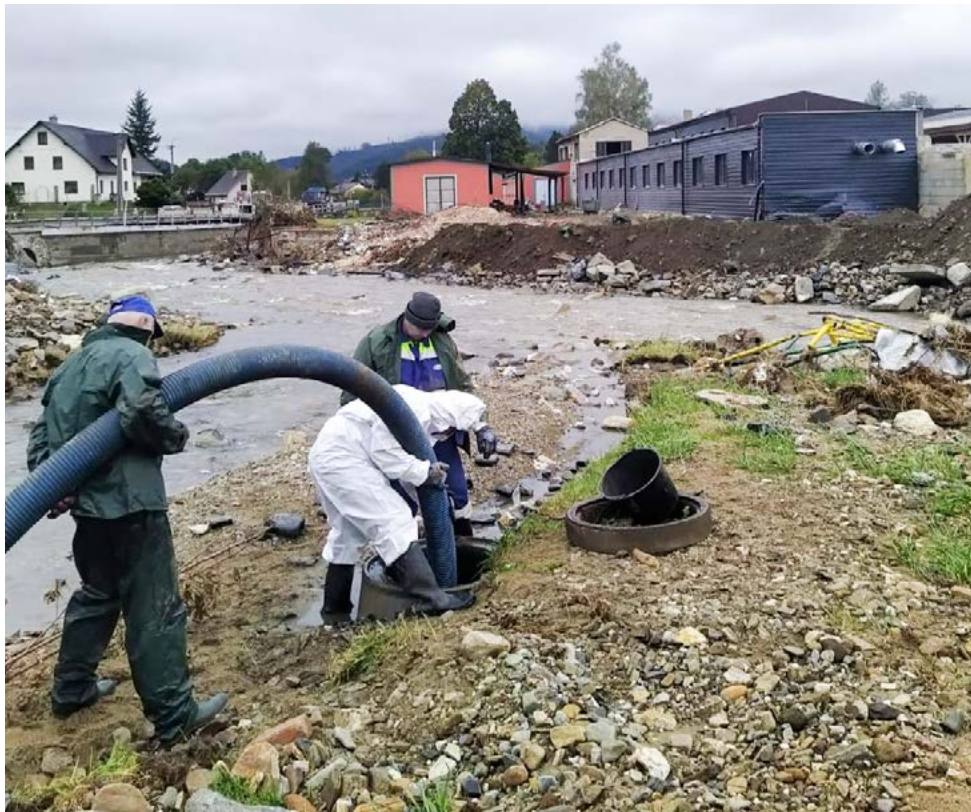
VaK Jesenicka začátkem října zprovoznily splaškovou kanalizaci z Bělé pod Pradědem do čistírny odpadních vod v České Vsi.

Za pomoci těžké techniky vojáků a hasičů, ale i díky dobrovolníkům, jsme mohli řešit hlavní poruchy – naplaveniny, splašky, poškození rozvodů a uzávěrů a četná přerušení vodovodů do námi zásobených obcí (Bělá pod Pradědem, Jeseník, Česká Ves, Písečná, Hradec-Nová Ves, Mikulovice). Za cenu mnoha provizorních řešení se