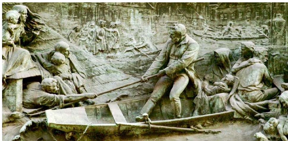
Fasádu františkánského kostela sv. Petra v Budapešti krásí od roku 1905 dílo Barnabáše Hollóa znázorňující Wesselényiho hrdinství během povodní.

Večer 27. dubna přednesla herečka Róza Laborfalvi na prknech peštského divadla báseň s názvem Az árvízi hajós , kterou významný literát Mihály Vörösmarty sepsal na Wesselényiho počest. Ani udatné skutky však barona neuchránily před soudním líčením. V únoru následujícího roku byl za protivládní postoje odsouzen ke třem letům vězení. Vzhledem k oprávněnému rozhořčení maďarské veřejnosti a díky přímluvě vlivných přátel i vleklé oční chorobě byl nicméně po dvou měsících z budínských kasemat propuštěn. Za uzdravením se odebral na daleký slezský Gräfenberk... To už je ale jiný, nám ne zcela známý příběh.