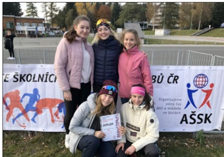
Republikové finále AŠSK v přespolním běhu družstev.