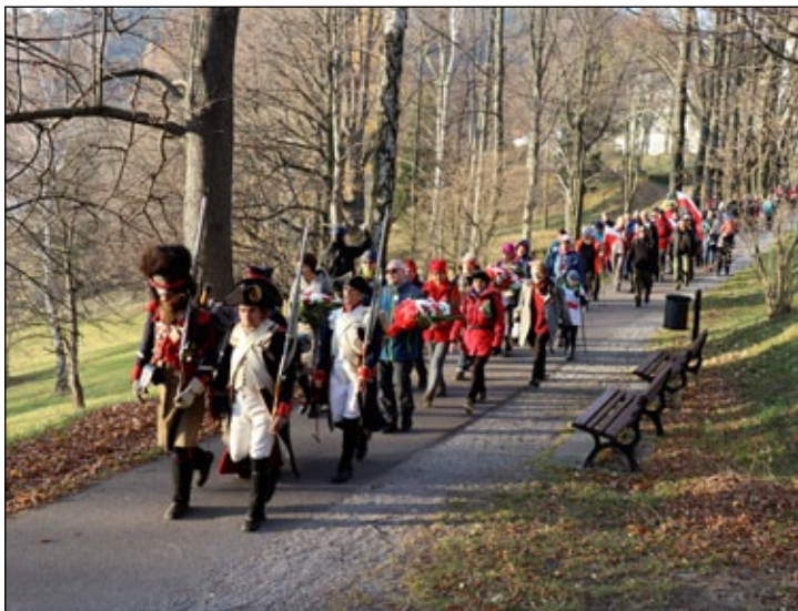
Partnerské město Glucholazy: Den nezávislosti. Při příležitosti polského Dne nezávislosti se uskutečnil tradiční pochod z Glucholaz do Jeseníku, zakončený u Polského pomníku. Účastníci pochodu položili květiny a zapálili svíčky. Zazněla polská hymna a proslovy. Pomník, který se nachází na lázeňské promenádě, věnovali Poláci na přelomu 19. a 20. století Priessnitzové památce.