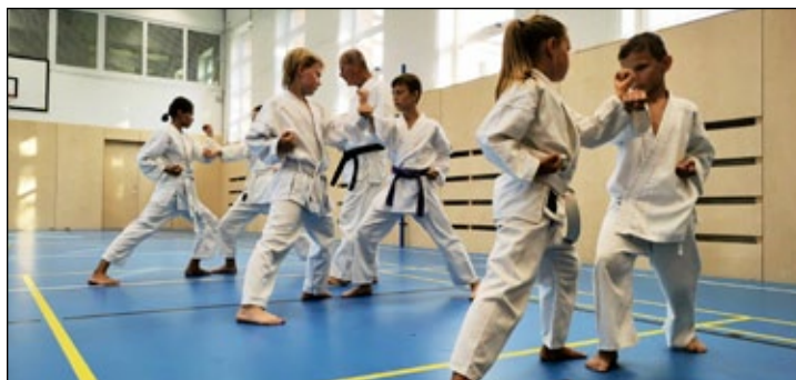
Trénink mladých karatistů.