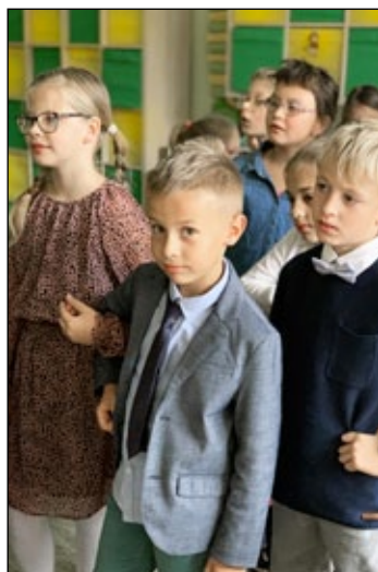
Suit Up Day.