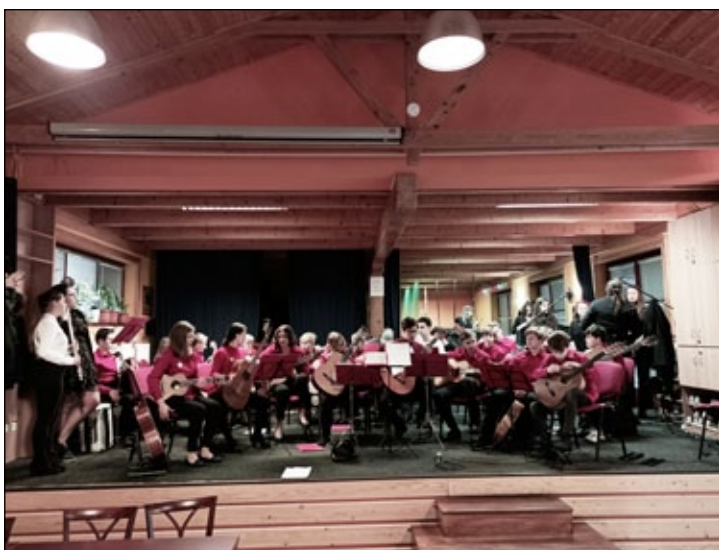
Kytarový orchestr ZUŠ Jeseník: Koncert. V listopadu se po delší době znovu představil svým posluchačům kytarový orchestr, a to na Skilandu v Ostružně. Zazněly písně z oblasti hudby populární, lidové či klasické.