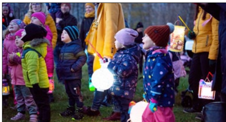
Martinovský večer v MŠ Jiráskova.