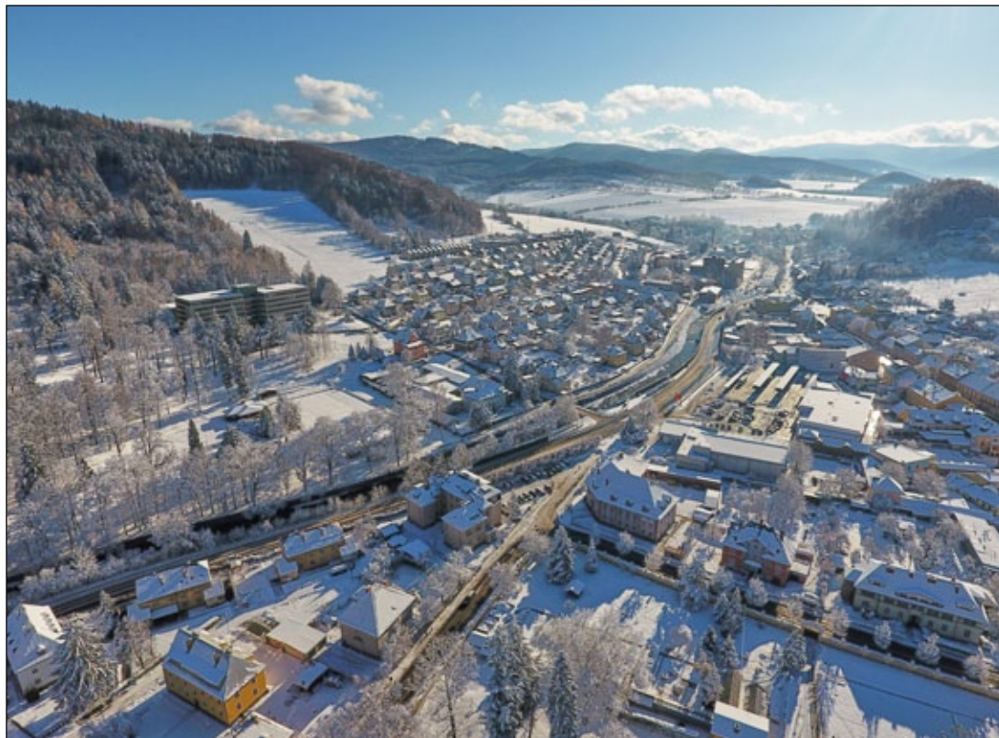
Zimní pohled na jihovýchodní část města Jeseník a hřeben jeseníckých hor.