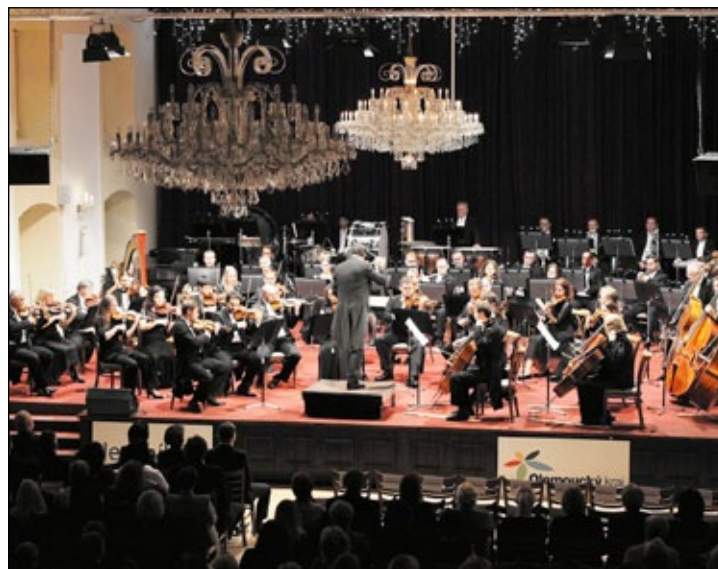
Moravská filharmonie: Oslavy státního svátku. Slavné filmové melodie v podání Moravské filharmonie Olomouc zazněly v pátek 22. října v lázeňském Kongresovém sále. Slavnostní koncert se uskutečnil ke Dni vzniku samostatného československého státu.