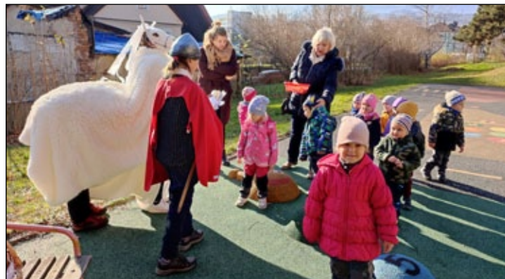
Do mateřské školy přijel svatý Martin na bílém koni.