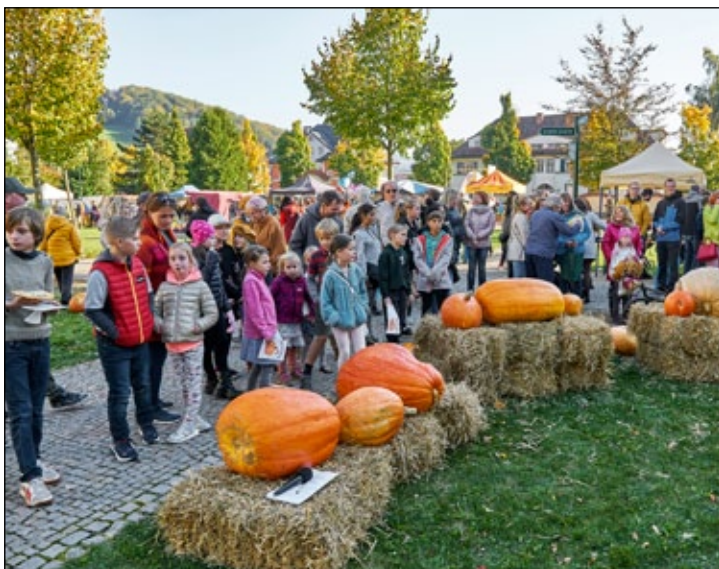
Spolek Sudetikus: Dýňová slavnost. V areálu bývalého kláštera proběhla tradiční Dýňová slavnost. Součástí akce byl jarmark s rukodělnými výrobky a obcerstvením, tvořivá dílnička či dýňové šachy. Samozřejmě nemohlo chybět velké množství různě vyzdobených dýní.