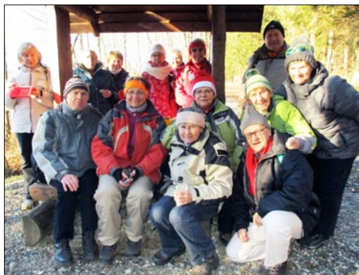
Klub turistů Jeseník: Výlety pro veřejnost. Klub jeseníckých turistů pořádá každý měsíc několik zajímavých výletů. Tentokrát šlo o túru na trase z lázni přes Nassauskou stezku, Studniční vrch a Ripperův kámen zpět do lázni.