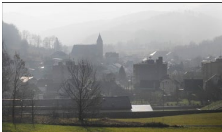
Současný pohled z někdejší maliřovy pozice.