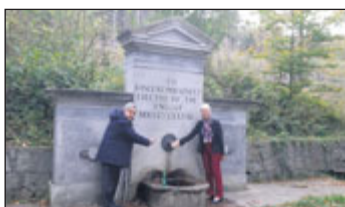
U Anglického pramene.