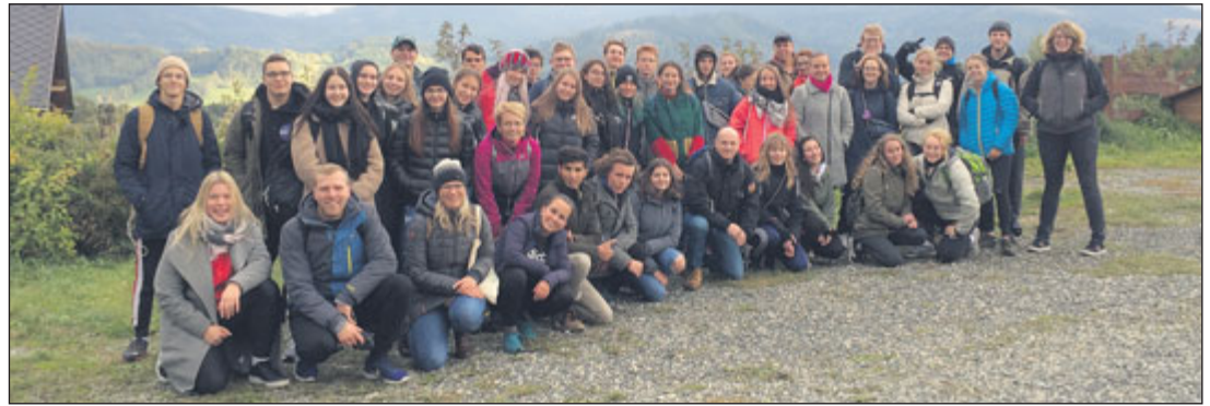
Studenti měli také příležitost poznat krásy Jeseníku a okolí.

První setkání se uskutečnilo na podzim 2017 rovněž v Jeseníku. Na jaře 2018 se pak studenti a učitelé všech škol setkali v Belgii, na podzim 2018 v Dánsku, na jaře 2019 v Lotyšsku a nyní přišel na řadu opět Jeseník. Projekt končí až v roce 2020, kdy se v únoru koná setkání učitelů zapojených škol a jejich kolegů v Belgii. Zde budou sdíleny příklady dobré praxe a dovednosti, které učitelé a studenti získali díky této spolupráci. Na přelomu dubna a května 2020 proběhne závěrečné