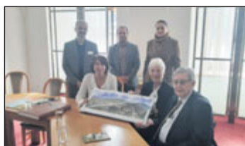
Návštěva na radnici.