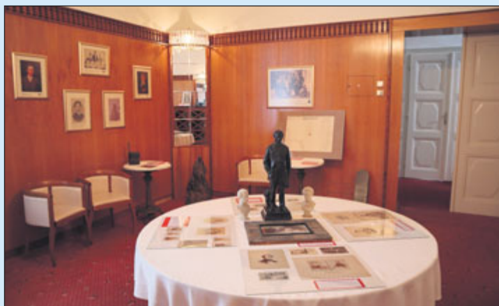
Výstava historických předmětů v Salónku Vincenze Priessnitze.