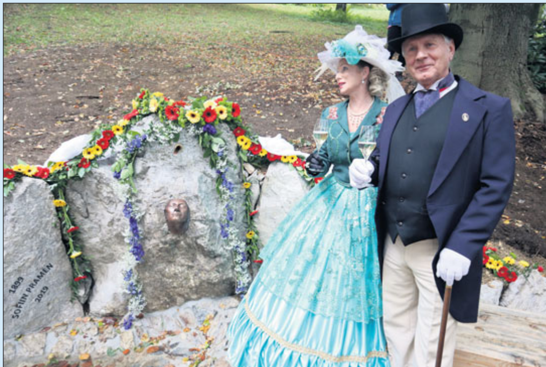
Odhalení a vysvěcení obnoveného Sofiina pramene zpestřil Spolek panstva v dobových kostýmech.

Od pátku do neděle probíhala 14. odborná konference na téma