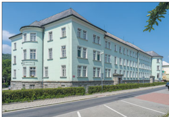
Poliklinika v Jeseníku.

k budoucnosti nový majitel. V poliklinice jsou postupně připraveny