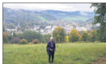
Na Muzikantské stezce.