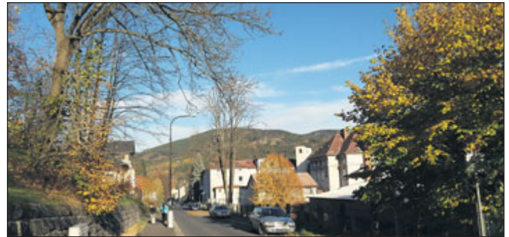
Tyršova ulice projde v příštím roce zásadní rekonstrukcí.

cesty domů byly příjemnými. Sídliště 9. května čeká na svou třetí etapu, kterou se nám zatím nepodařilo zafinancovat za podpory dotací, uvažujeme tedy nad variantou financování z městského rozpočtu. Vypracovali jsme studii na obnovu sídliště Pod Chlumem, které netrpělivě čeká na svou obnovu a zasloužilo by si stejnou pozornost a péči jako třeba ulice Tyršova. V příštím roce se již lidé mohou těšit na první stavební úpravy. Pracovat se bude i na sídlišti Lipovská, chodníky dostanou nový kabátek a motoristé nová parkovací místa.