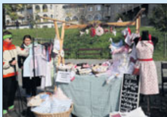
Jarmark historických řemesel.