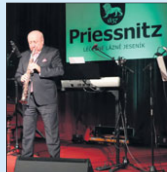
Fenomenální Felix Slováček.