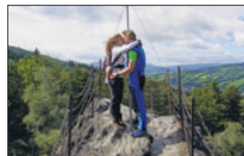
Čertovy kameny.

Olomouc. Vlak v 7:01 hod., vedou Jana a Franta.