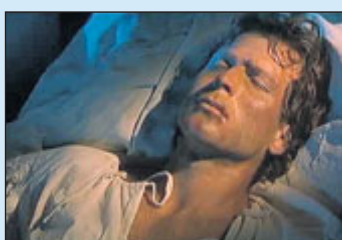
Záběr z filmu o Priessnitzovi.