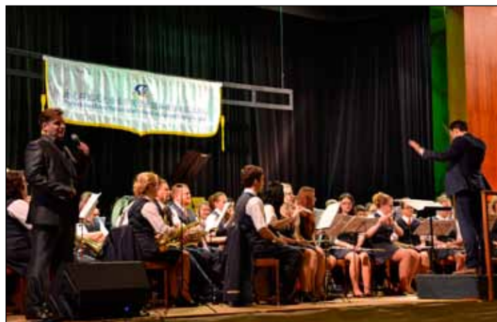
Dechový orchestr mladých naladí své posluchače na večerní městský bál v sále budovy IPOS.