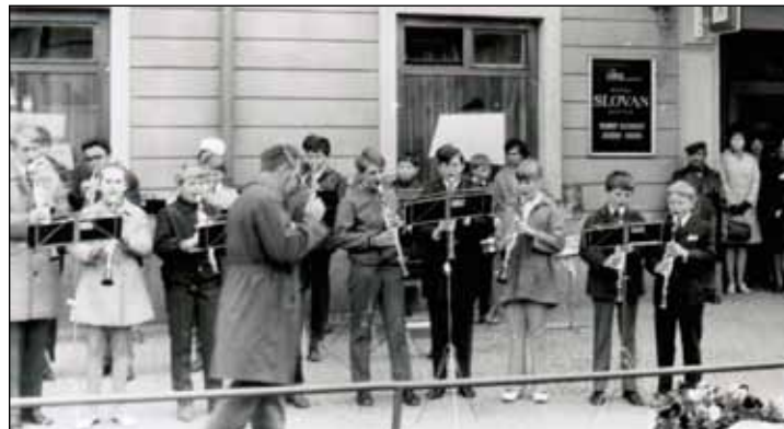
První koncert DOM Jeseník před hotelem Slovian v roce 1971.

Městský bál se uskuteční v sobotu 20. listopadu od 20.00 v sále IPOSu. Vstupenky lze zakoupit