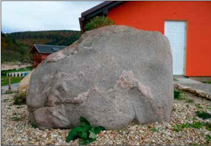
Na Jesenicku dnes najdeme tři více než dvoumetrové bludné balvany severoevropských hornin. Zatím poslední byl objeven roku 2004 při budování Helenčina rybníka v areálu rekreačního střediska Patolda v Mikulovicích. Tvoří jej žula z ostrova Bornholmu, jeho rozměry činí 2,25 × 1,5 × 1,35 m.

Nánosy skandinávského ledovce překypují rozmanitostí horninových valounů a balvanů. Pokud jde ale o vzácnosti vyjádřitelné měřitelnými parametry, sběratelé, badatelé i odborná literatura si všimají hlavně největších exemplářů bludných balvanů, pazourkových hlíz a úlomků jantaru. V našem regionu se ledovcové uloženiny vyskytují na severním úpatí Rychlebských hor a Zlatohorské vrchoviny, kam okraj ledovcového štítu zasáhl. Srovnáme-li tuto oblast se sousedními pohraničními úseky ČR, které byly rovněž zaledněny, zjistíme, že v tomto ohledu držíme zajímavé rekordy.