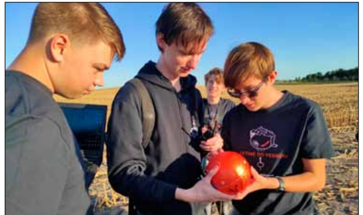
Tým R.U.R. po nalezení sondy.

Týmy nyní čeká práce se zpracováním dat a fotografií zakřivení Země, které jsou uloženy v sondě. Studenti získají také video a unikátní fotografie z výšky, kam se člověk běžně nedostane. Po zpracování všech vý-