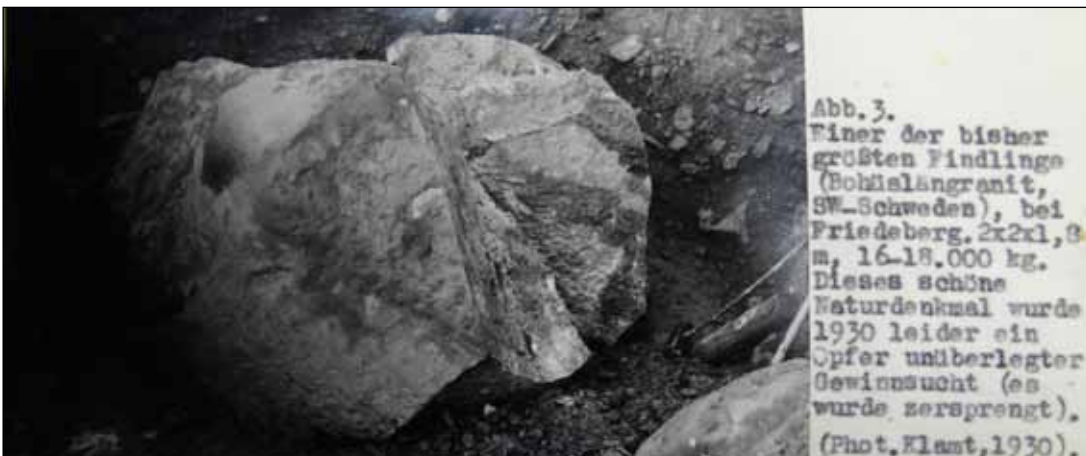
Největší bludný balvan na Jesenicku (žula z regionu Bohuslän v jz. Švédska) krátce po svém nález a rozbití v Žulové roku 1930.