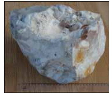
Největší pazourek na Jesenicku, měřítko: 20 cm.

Zasluhou vidnavského vlastivědce Franze Kieglera se tento pazourek dostal do geologické sbírky městského muzea ve Vidnavě a odtamtud po druhé světové válce do dnešního Vlastivědného muzea Jesenicka. Trvalé uložení v řádně evidované sbírce zaručuje tomuto výjimečnému exempláři ochranu před ztracením či rozbitím.