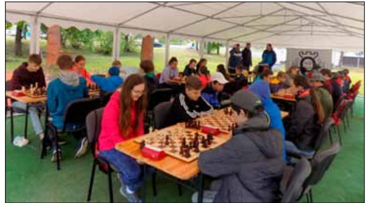
Open air turnaj mládeže před klubovnou.

Tento pozemek byl do roku 2017 dlouhá léta neudržovaný a zarostlý náletovými dřevinami. Díky tomu si zřejmě získal oblibu mezi místními bezdomovci a narkomany, po kterých zde zůstávaly použité injekční stříkačky a podobné nebezpečné věci. Vzhledem k těmto okolnostem jsme se před čtyřmi lety ve spolupráci s městem Jeseník a olomouckým arcibiskupstvím, kteří pozemky před klubovnou vlastní, rozhodli tento prostor vyčistit a zkulturnit. Chtěli jsme