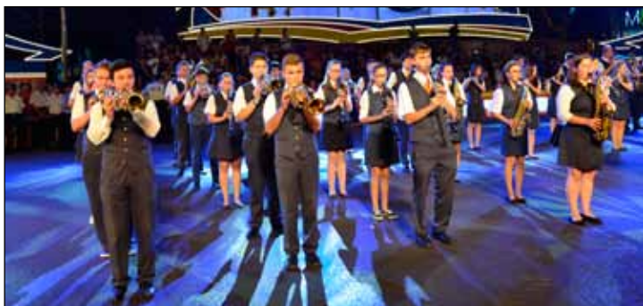
Vystoupení orchestru v čínské Šanghaji v roce 2015.