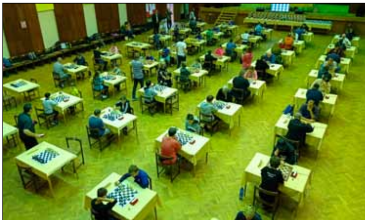
3. ročník Memoriálu Svatopluka Hastíka.