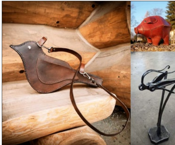
Tři oceněné práce studentů školy.