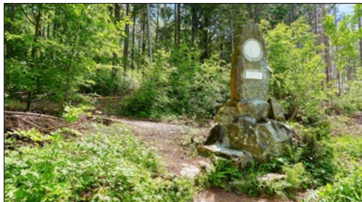
Současná podoba pramene U Vousáče.

Pramen se nachází asi 200 metrů nad Anglickým pramenem, na horním okraji městského parku. Pramen byl původně věnován rakouskému císaři Františku Josefovi I., postaven byl v první polovině 50. let 19. století. Původně měl podobu mohyly složené z masivních bloků skal a mramorové desky. V roce 1898, k příležitosti padesáti let vlády císaře, byl pramen přestavěn na pomník, kterému vévodí ka-