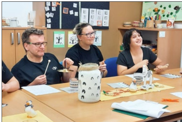
Nové pracoviště Charity Jeseník na Masarykově náměstí.