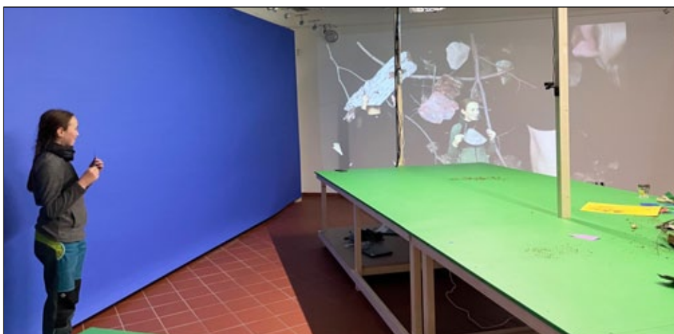
V rámci programu Současné umění pro Jeseník probíhá výstava R. Loskota: Přes stromy nevidím kraj lesa. Přináší působivou světelnou a zvukovou instalaci a ateliér pro experimenty s filmařskou technikou „klíčování“.

HAFTAŇAN A TŘI MUŠKETÝŘI / 84 min / animovaný / Španělsko, 2022 / mládeži přístupné