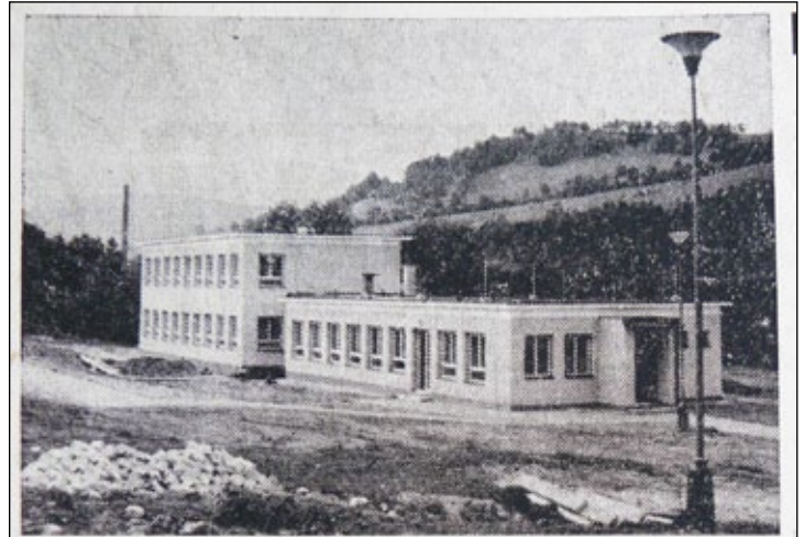
Budova nové mateřské školy a jeslí v areálu sídliště u Jatek, pro 80 dětí ve věku 1 až 6 let. Je to další zlepšení pro zaměstnané ženy.

Přestože šlo o zařízení poskytující péči a výchovu dětem předškolního věku, jak dokládají zápisy v jeho kronice, stranou politického dění nezůstalo. Zatímco koncem 60. let šlo o víceméně spontánní komentáře reagující na události pražského jara a vpád vojsk Varšavské smlouvy, s počátkem 70. let nastala patrná změna daná nastupující normalizací. V dalších dvou dekadách tak probíhala výchova dětí v komunistickém duchu a její součástí byla i cvičení