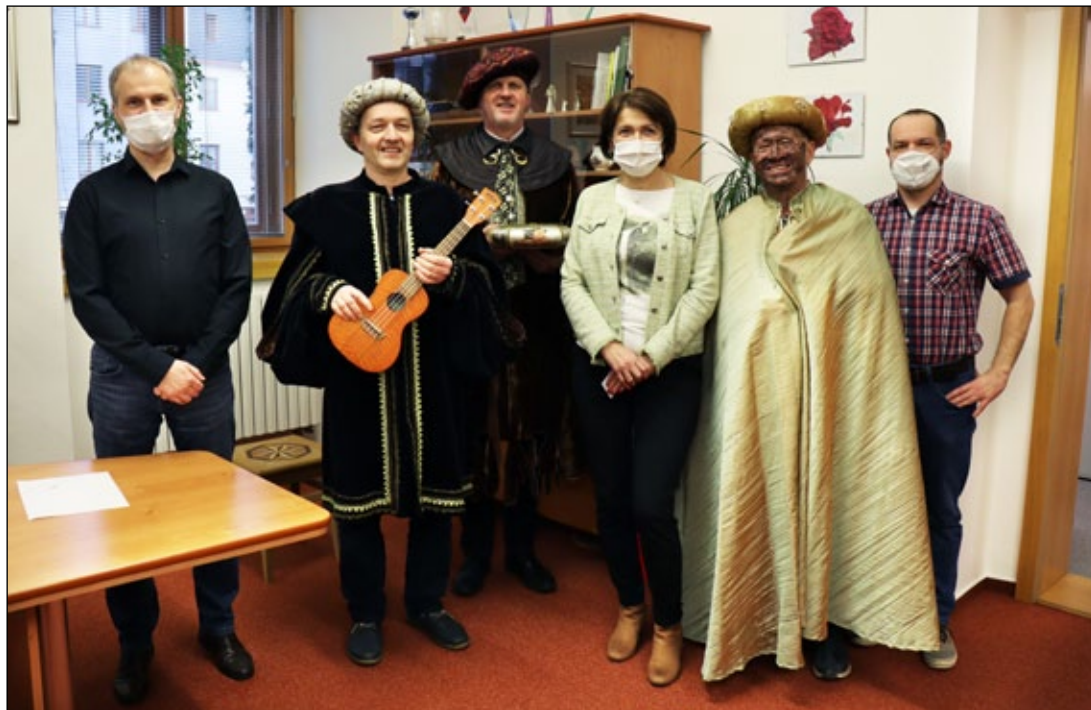
Tri králové navštívili při koledování také radnici. Výtěžek ze sbírky bude použit na výstavbu Denního stacionáře Šimon v Jeseníku.

Jeseník bude mít na olympijských hrách dvě želízka v ohni | 14 |