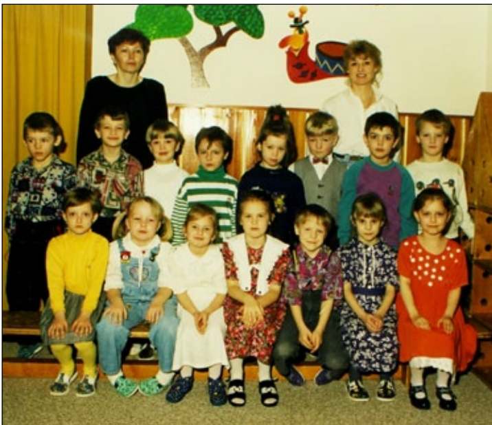
Děti z II. oddělení v posledním roce existence mateřské školy.