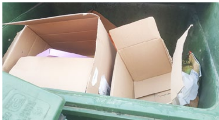
Kontejner na směsný komunální odpad na sídlišti v našem městě (dva dny po vývozu).

Na fotografii můžete vidět, jak může vypadat kontejner na směsný komunální odpad na sídlišti v našem městě (dva dny po vývozu). Plný využitelných odpadů, které v tomto