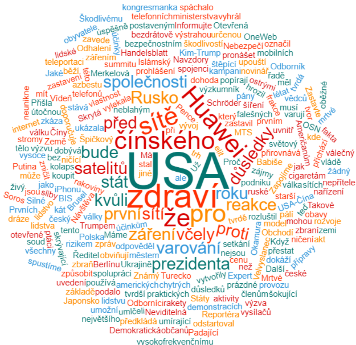
Obrázek 7: Wordcloud sestavený z titulků zkoumaných 31 článků