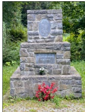
Pomník Nezapomeneme v Horní Lipové.

Jedno je jisté. V odpovědi národního výboru ve věci evidence pomníků a památníků v září 1947 není o německém pomníku ani zmínka. V obci je veden pouze český pomník, který postavili zdarma svépomocí členové sboru dobrovolných hasičů