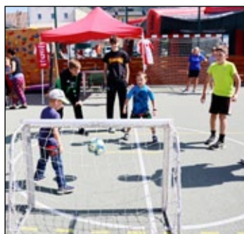
Sport pro Jeseník.

Areál jeseníckého gymnázia hostil přehlídku místních a regionálních sportovních klubů. Akce s názvem Sport pro Jeseník 2021 se uskutečnila první zářijovou nedělí a mezi občany měla velký úspěch.