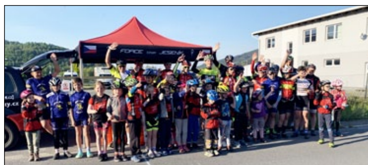
Vyhlašeni jednoho ze závodů JesTour.