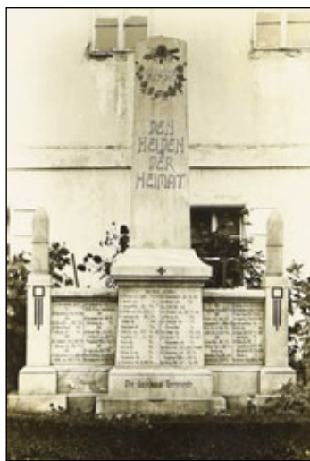
Pomník obětem první světové války.

O stavbu pomníku se zasadila téměř celá obec. Jak by ne, když se z války domů nevrátilo 67 mužů, jejichž jména byla vyryta do kamene.