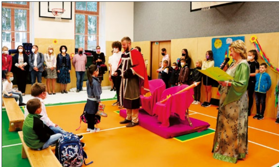
Celkem 74 prvňáčků bylo 1. září slavnostně pasováno na žáky Základní školy Jeseník. Ta letos otevřela tři běžné třídy, jednu Montessori a jednu přípravnou třídu. Pan ředitel v roli krále a paní zástupkyně v roli rádkyně prvňáčky za doprovodu žáků devátých ročníků vyslali k novým třídním učitelkám a do připravených tříd. Přejeme vydařený začátek nové etapy všem aktérům: žákům, rodičům i jejich učitelkám.

Sourozence Nikoly Šuhaje žil v Široké Nivě | 13 |