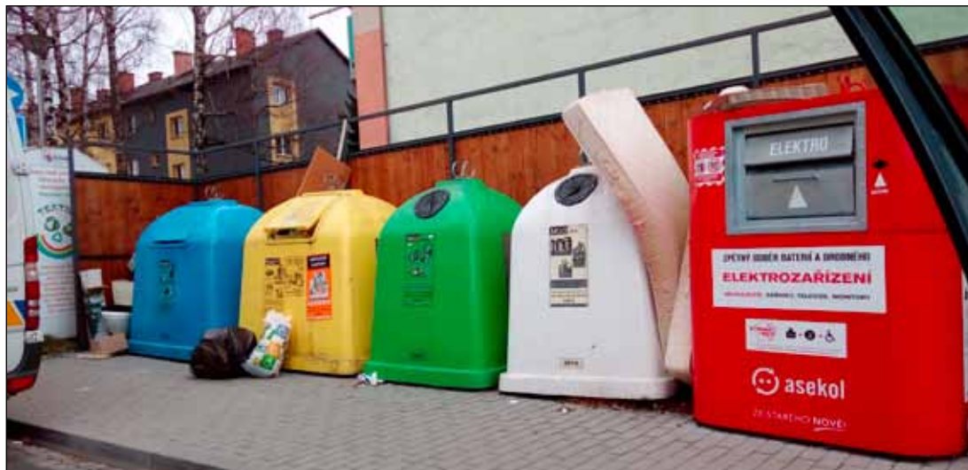
Sběrné nádoby poblíž křižovatky ulic Dukelská-Vaškova, kde lidé založili černou skládku.

Abychom tomuto zabránili, projíždí košová služba celý týden město a průběžně likviduje tyto černé skládky. Pracovníci této služby však nemohou být všude a hlavně nezřídkou dochází k tomu, že krátce po odklizení volně odložených odpadů