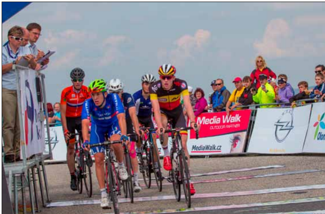
K divácky atraktivním patří etapa s výjezdem na Dlouhé stráně.