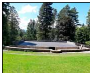
Nové lavičky budou instalovány do prostoru letního divadla.

Na participativní rozpočet vyčlenilo město Jeseník ze svého rozpočtu původně milion korun, z toho se za 60 tisíc korun realizovaly projekty na místní základní škole: potkáva-