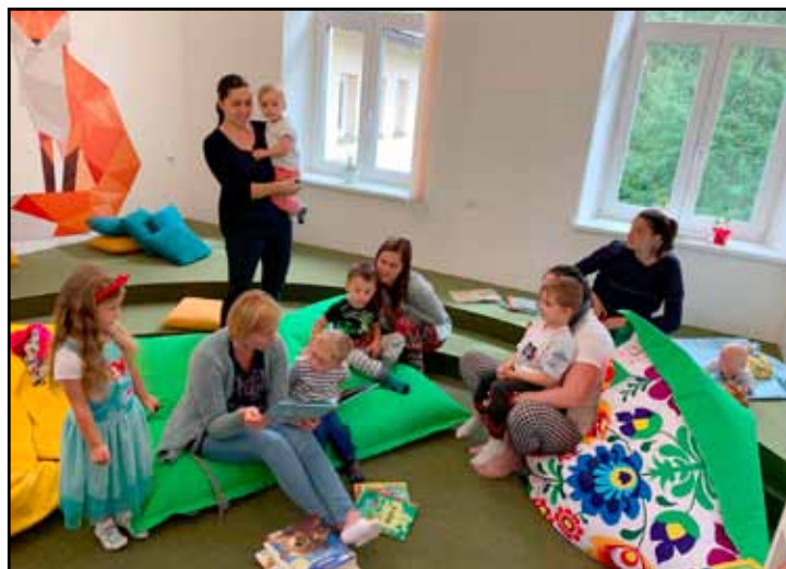
Maminky s dětmi našly v nových prostorách Knihovny Vincence Priessnitzze příjemnější zájem. Snímek z akce Česko čte dětem pořádané ve spolupráci s MRC Krteček.