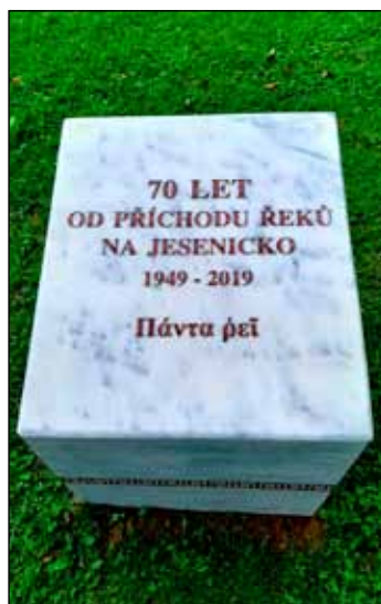
Řecký pomník je umístěný na náměstí Svobody.

Během slavnosti mohli návštěvníci akce ochutnat řecké speciality, příjemnou atmosféru navodila řecká hudba jeseníckého souboru Axios. Tradiční kroje, zpěv a hudbu na gajdy předvedl řecký soubor Evros z Javorníku. (rik)