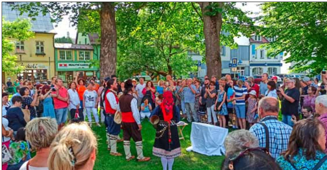
Slavnostnímu odhalení přihlížely desítky lidí, do Jeseníku přijeli Řekové z okolních měst a obcí.