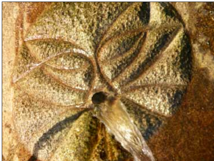
Oblíbený reliéf Knoppova pramene je moderní variací středověkého motivu „zeleného muže“, který je znám z průčelí měštanských domů a kleneb katedrál. Ve středověké kosmologii představoval Zelený muž skryté působící inteligenci přírody.

pohybovali mezi lázněmi, městem a Křížovým vrchem. Mohli tak během jednoho dne procítit všechna „témata“ městské krajiny. Jeseník se nachází mezi lázeňským kopcem, s jemnou „jinovou“ ženskou esencí, a Křížovým vrchem, s aktivní