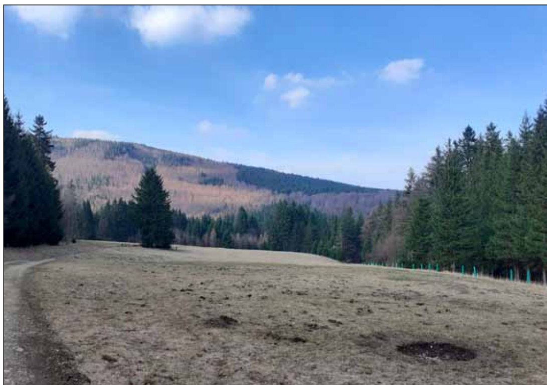
Skelná louka u Ramzové, současnost.