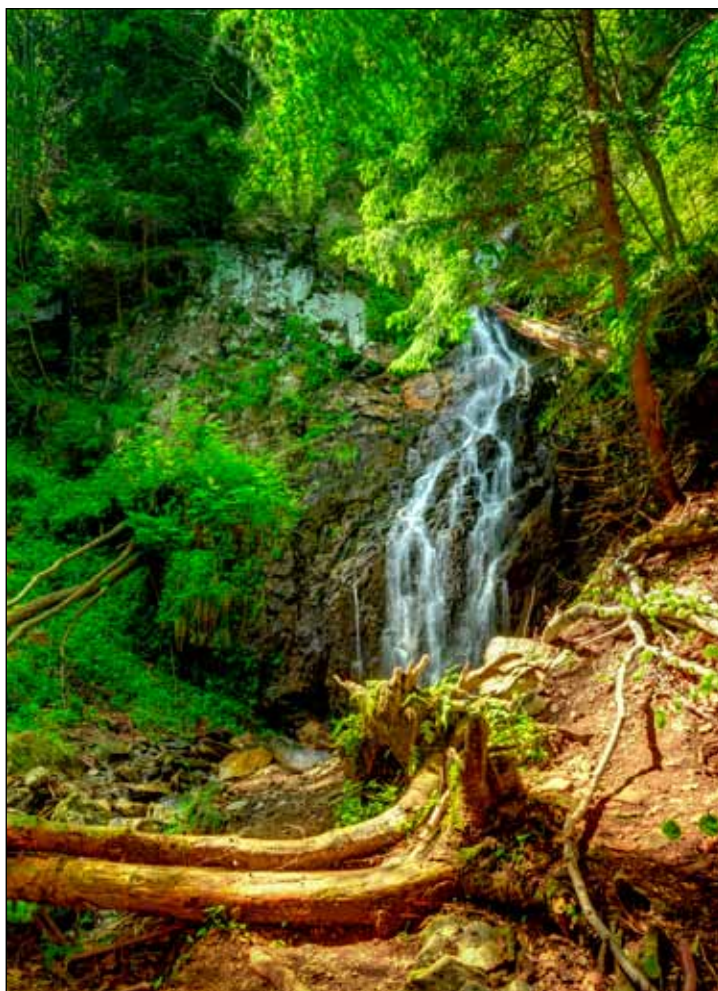
Královský vodopád na první pohled překvapí svou výškou. Skalní stěna, ze které padá, je více než 15 metrů vysoká.