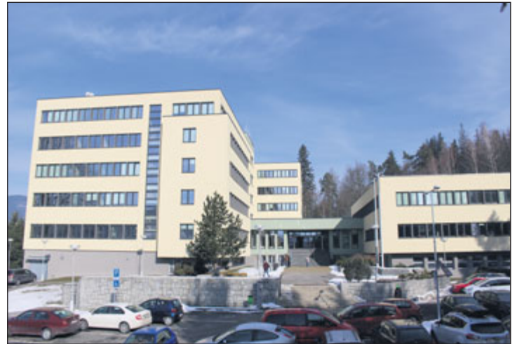
Budova IPOS je velký administrativní komplex.