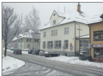
Poštu čeká rekonstrukce.

Z důvodu rekonstrukce přepážkové haly a zázemí pošty Jeseník 1 v Poštovní ulici dojde od 30. 1. 2019 do předpokládaného data 31. 5. 2019 k dočasné změně otevírací doby. Obsluha zákazníků bude probíhat u přepážek v náhradních prostorách pošty.