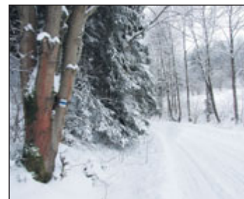
Paní zima zve na výlety.