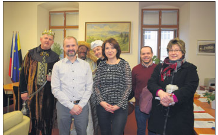
Tři králové zavítali také na radnici v Jeseníku.