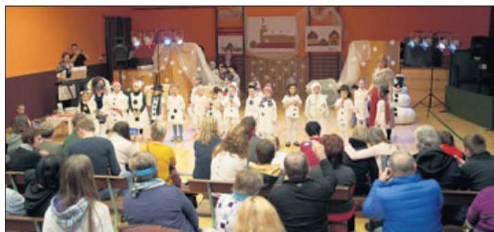
Vystoupení dětí na vánoční besídce sklídilo úspěch.