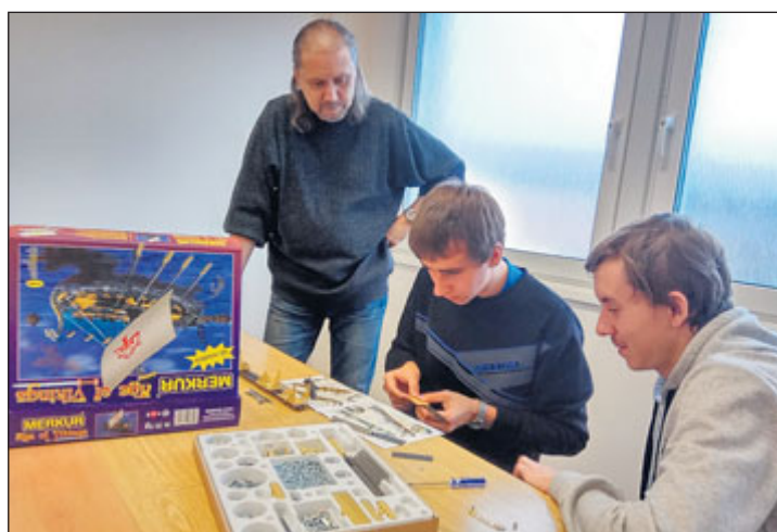
Multifunkční výuková učebna „MERKUR“

čích kovů, instalatér a zedník. Některé prostory v objektu praktické výuky nebyly využívány, a proto v rámci modernizace vznikla i multifunkční výuková učebna, do níž byly zakoupeny stavebnice MERKUR. Díky realizaci projektu se významně podpoří zkvalitnění a ztraktivňování výuky a zároveň napomůže lepšímu uplatnění žáků na trhu práce. Multifunkční výukovou učebnu „MERKUR“ mohou využívat i žáci a děti ze ZŠ a MŠ, a tak se podpoří větší zájem dětí o technické a řemeslné činnosti. Spolupráce byla uzavřena se ZŠ Jeseník, ZŠ a MŠ Lipová-lázně, ZŠ a MŠ Bělá pod Pradědem, OU