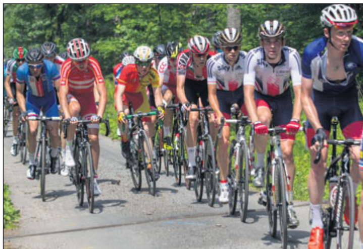
Opět po roce zavítá Závod míru do Jeseníků.

O tom, že se Závod míru zabydlel mezi naprostou světovou špičku svědčí fakt, že již třetí rok je zařazen do seriálu světové cyklistické federace UCI jako jeden ze závodů N Cup (Pohár národů), který obsahuje jen šest závodů na celém světě, a spolu s Tour de Avenir patří mezi dva nejprestižnější závody mladých cyklistů do 23 let.