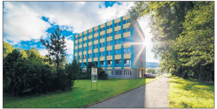
Škola kromě výuky nabízí také kurzy a další služby.

Škola ale nepřispívá pouze k rozvoji technických předmětů, ale podporuje i předměty všeobecně vzdělávací. Díky projektu ERASMUS+ škola získala grant na zahra-