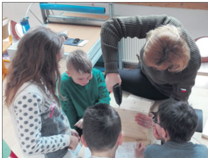
Děti se zájmem přihlížely výrobě budek pro netopýry.

Tentýž den se v odpoledních hodinách konal výukový program a workshop v ZŠ Průchodní v režii sdružení ČESON. Lektori představili výukový program pro pedagogy, jehož smyslem bylo ukázat učitelům, jakou formou pracovat s dětmi při šíření osvěty o ochraně netopýrů. Součástí přednášky byla audio-nahrávka hlasů netopýrů z ultrazvukového detektoru. Nevšedním zážitkem byla i možnost zblízka si prohlédnout a pohledit živě, trvale handicapované netopýry. Ze ZŠ Průchodní byly vybrány děti, které se programu zúčastnily a mohly se tak společně s pedagogy podílet na tvorbě budek pro netopýry. Pro účastníky to byl zajímavý program. Některé informace, včetně výroby budek, mohli totiž okamžitě aplikovat do praxe.