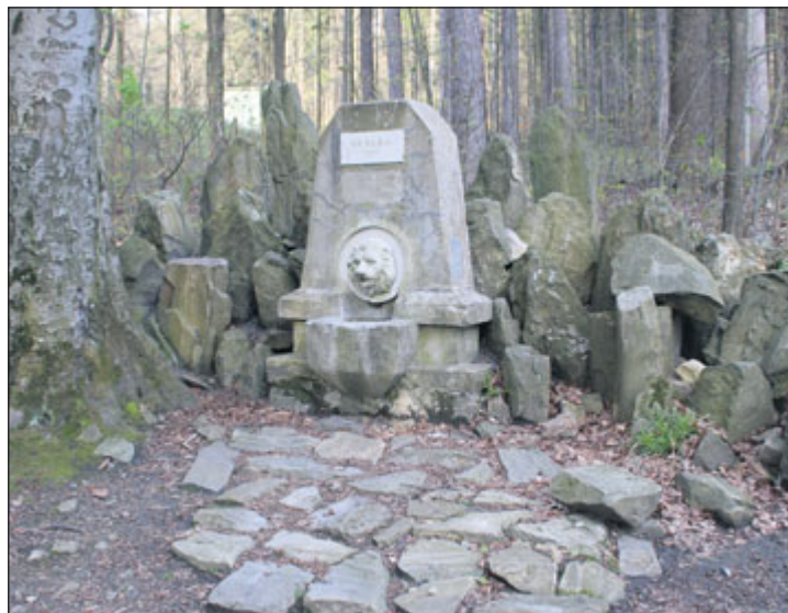
Pramen Skalka v dnešní podobě.