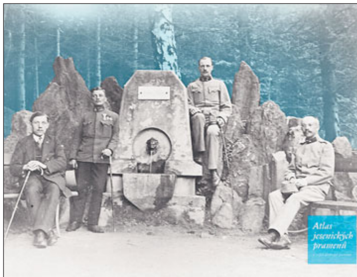
Podoba pramene z počátku 20. století.