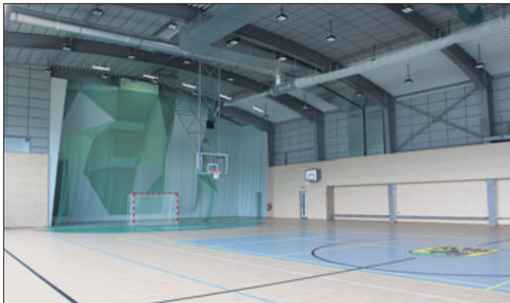
Lezecká stěna patří k největším na Moravě.