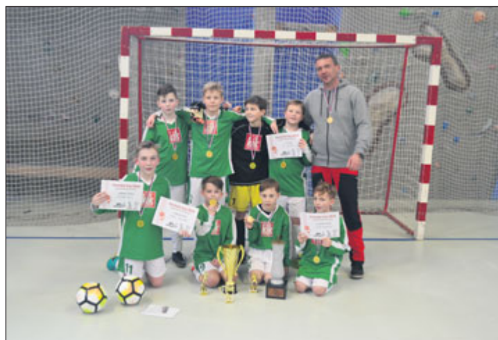
Vítězný tým turnaje Základní škola Jeseník.

Ve skupině A nakonec muselo o postupujícím rozhodnout skóre vzájemných zápasů mezi prvními třemi družstvy, které nakonec bylo nepříznivé pro Českou Ves, která tak vlastně po jediném nevydařeném utkání zůstala těsně před bránami bojů o obhajobu loňského titulu. Naopak do dalších zápasů postoupil tým z Jeseníku a Bělé pod Pradědem. Ve druhé skupině předvádělo pohledný fotbal družstvo z Mikulovic, ale díky špatné koncovce a možná i troše smůly skončilo ve skupině až čtvrté. Naopak