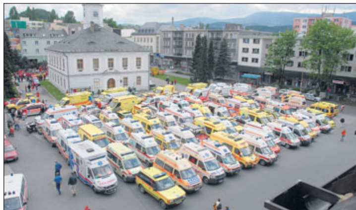
Rallye Rejvíz zavítá do Jeseníku.