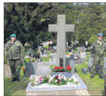
Pomník Obětem války.

Město Jeseník pořádá u příležitosti státního svátku „8. květen – Den vítězství“ pietní vzpomínkovou akci za účasti představitelů města.