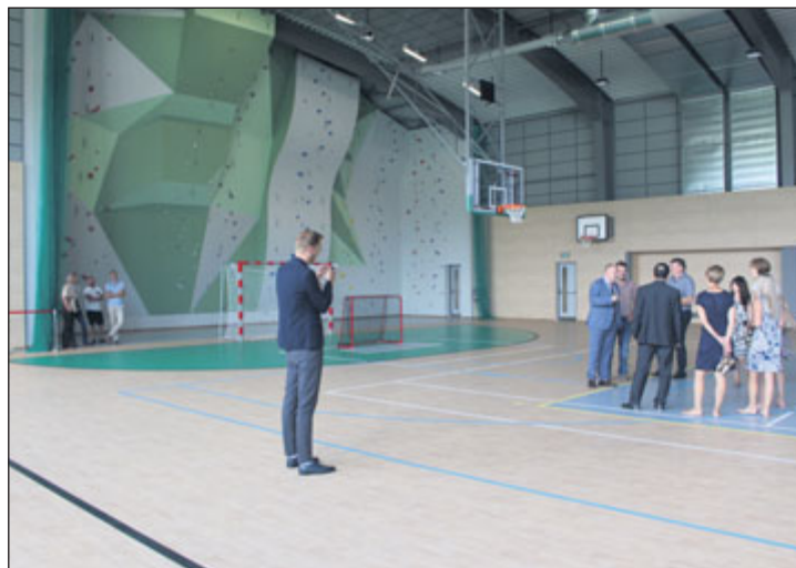
Dominantou sportovní haly je horolezecká stěna.