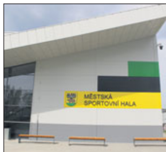
Halu hlídá kamerový systém.