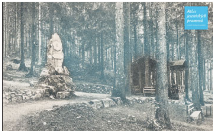
Poblíž pramene původně stál také altán s tanečním parketem.