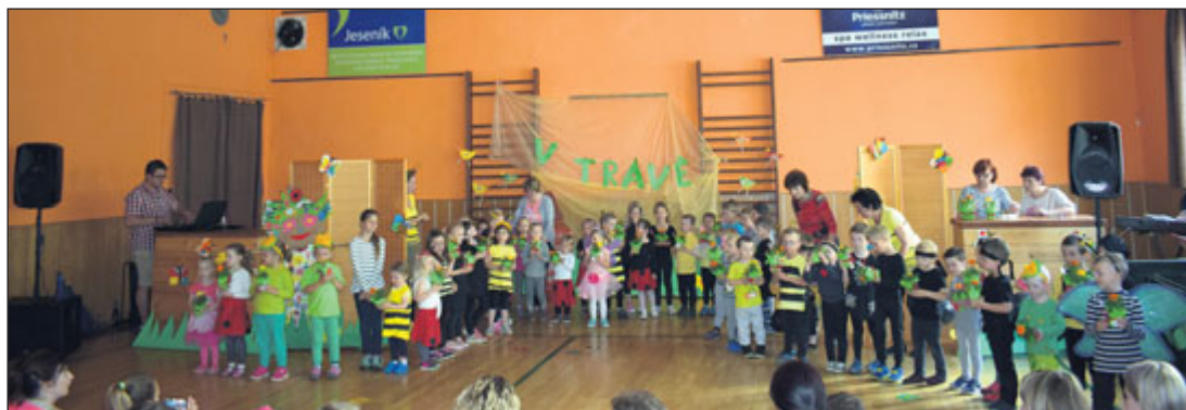
Představení „V travě“ sklídilo u rodičů i dětí velký úspěch.