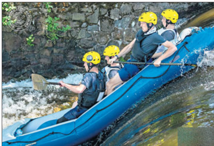
Díky skvělým výsledkům byli raftáci vybráni do reprezentace ČR.

V tomto roce se také jedou nominační závody R6 (šestimístné rafty).