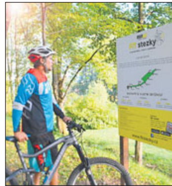
Nová stezka v Dolní Lipové.

K návštěvě nové FIT stezky zve obec Lipová-lázně. Nachází se v areálu parku Johanna Schrotha v Dolní Lipové a postará se o protažení a posílení vašich svalů. Má deset stanovišť a je dlouhá cca 500 metrů. Návštěvníkům umožňuje výběr ze tří různých stupňů obtížnosti tréninku. Na informačních panelech jsou uvedené pokyny ke cvičení na daném stanovišti a další zajímavé informace včetně hádanky pro děti.