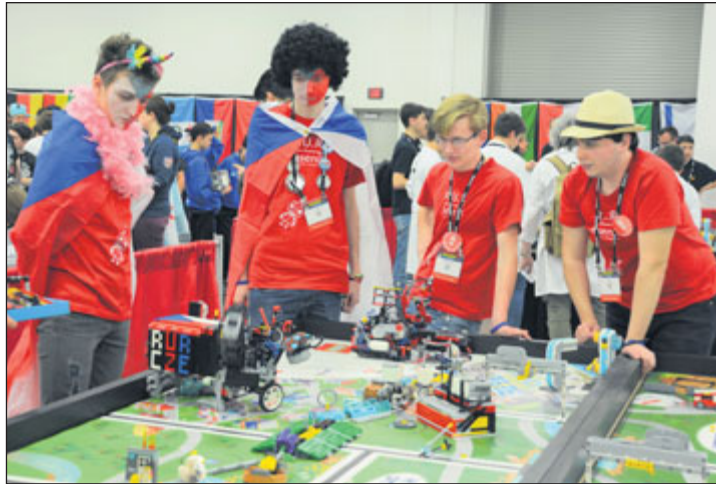
Světové finále soutěže FLL proběhlo v Detroitu.

Světové finále je svátkem robotiky s účastí nejlepších týmů. Vedle jednotlivých disciplín zde družstva prezentovala svou zemi, město či výzkumný úkol. Jesenický stánek přitahoval poutavým vzhledem se sloganem: Česká republika – země, kde vzniklo slovo robot.