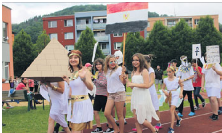
Doškolná se nesla v olympijském duchu, dorazili i sportovci z Egypta.