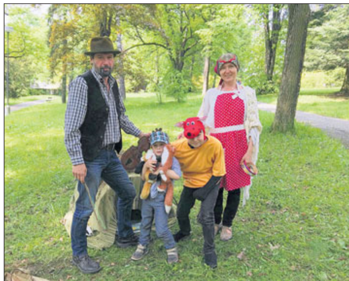
Děti se dostaly také do pohádky O Budulínkovi.

Zvonilka s pirátem ukázali dětem, jak se hází dělovou koulí, ježibaba se ježdědkem nabrali děti na lopatu, s princem si děti zastřílely na draka, po cestě potkaly Budulínka s liškou a zazpívaly mu písničku, Machovi našly kouzelné sluchátko a Vodníkovi vylovily rybičky. S Karkulkou děti sbíraly kytičky, Pejskovi a kočičce uvařily dort, s Kátou a Škubánkem navlékaly korále, Makové panence skládaly obrázek a nakonec házely Boba a Bobka do klobouku. V cíli děti prolézaly tunelem