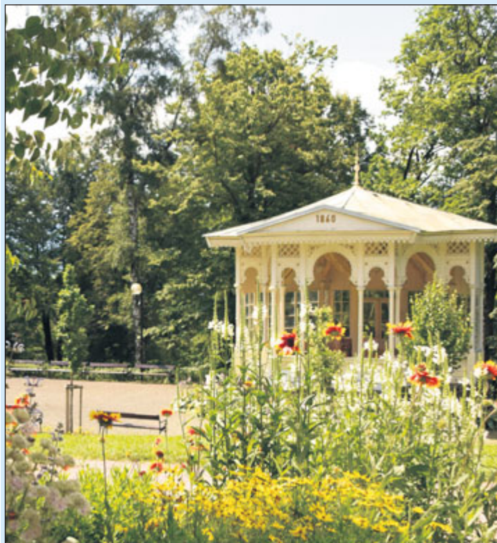
Hudební altán na Ripperově promenádě.