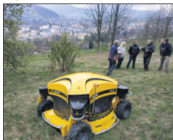
Prezentace sekačky.

Zastane práci až několika pracovníků s křovinořezem. Reč je o svačkové sekačce Spider, kterou zakoupily technické služby. Svou roli při rozhodování, zda sekačku pořídit nebo ne, sehrály i další faktory jako nižší hlučnost, bezpečnost a kvalita seče. (rik)