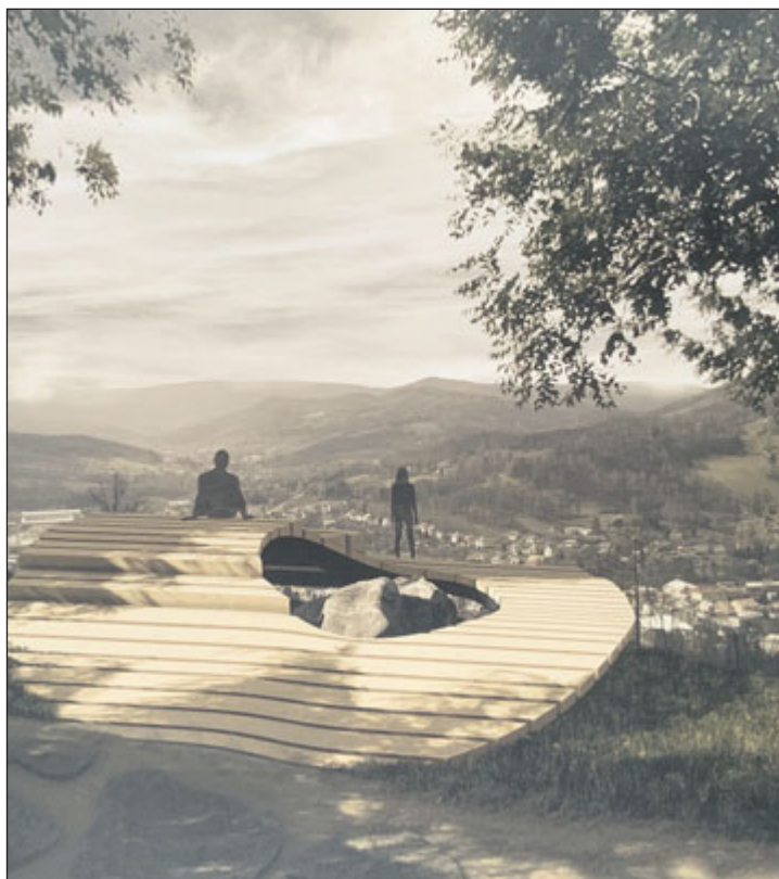
Jeden z návrhů, jak propojit město s okolní přírodou.