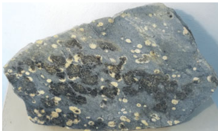
Žula od Stockholmu, sbírka VMJ. Rozměry leštěné plochy 44x26 cm.

Náš exponát se plně shoduje s žulami v okolí švédské metropole Stockholmu. Tamější krajinu budují přeměněné horniny, vzniklé metamorfózou usazených hornin, a do nich proniklé žuly. Skvrnitá žula tvoří v okolních horninách žíly. Proces natavení starších hornin a utuhnutí magmatu i s příměsemi proběhl ve starohorách asi před jednou a třemi čtvrtinami miliardy let. Tohoto stáří dosahuje i naše skvrnitá žula. Hostitelské horniny, jimiž magma prostupovalo, jsou tedy ještě o něco starší. Vysokému věku skvrnitě žuly se nelze divit. Území Švédska je součástí nejstaršího geologického základu Evropy. Většinu švédského území tvoří horniny vzniklé ve starohorách před necelými dvěma miliardami let. V uvedené době došlo srážkami zemských desek ke spojení malých pevnin a skupinek ostrovů do jednoho z prvních velkých kontinentů. Přitom nastala přeměna obrovských horninových komplexů a rozsáhlé podpovrchové průniky magmatu. Naše skvrnitá žula tak byla součástí velkolepého pevnino-