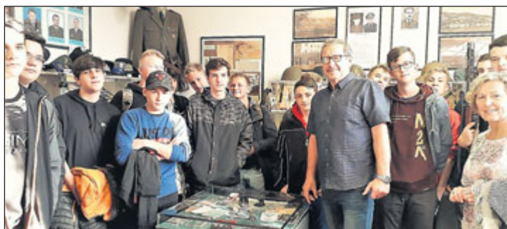
V muzeu se pořádají také besedy pro školy.