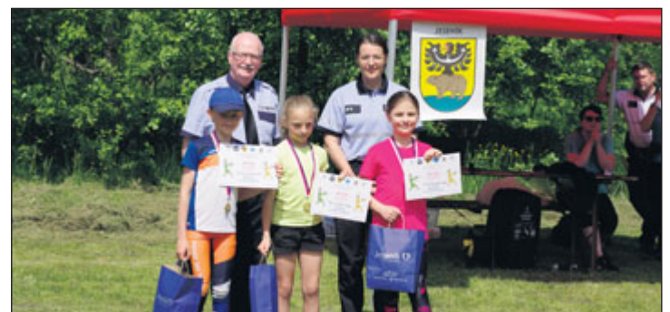
Vítězné družstvo starší kategorie.