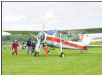
Soutěž parašutistů.

Jeseničtí parašutisté pořádají v sobotu 13. července na polním letišti v Hradci-Nové Vsi mezinárodní závody v přesnosti přistání. Závodníci budou z Česka, Polska, Německa a Ukrajiny. Závody začínají v 8.00 a pokračují přibližně do 19.00 dle rychlosti průběhu závodů, počtu závodníků a počasí. Tréninkové seskoky proběhnou v pátek. Kromě velmi zajímavé podívané a atraktivního prostředí je připravené občerstvení, pro děti skákací hrad a pro všechny vyhlídkové lety v letadle Cesna 172. (jb)