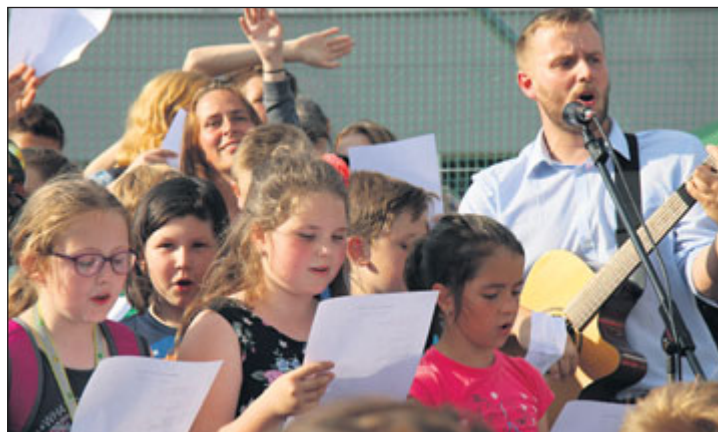
Po křtu školního řádu si všichni zazpívali.