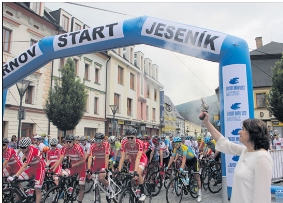
Starostka města Zdeňka Blišťanová odstartovala první etapu Závodu míru U23.