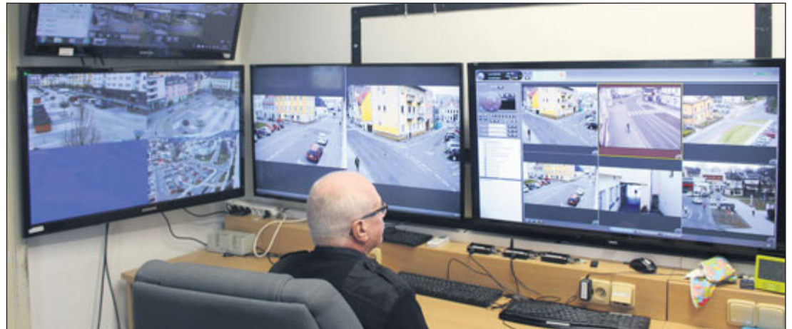
Přenosy z kamer se sbíhají na městské policii.