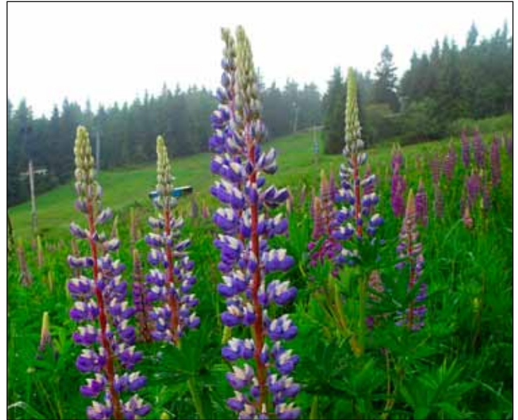
Invazní rostlina vlčí bob mnoholistý na Červenohorském sedle.

Asi nejčastěji se však můžeme setkat s křídlatkami. Z východní Asie k nám byly zavlečeny dva druhy, křídlatka japonská a křídlatka sachalinská. Oba patří k nejspěšnějším, a tudíž nejvíce škodlivým invazním druhům. Aby toho nebylo málo, mohou se tyto dvě křídlatky křížit, přičemž plodem jejich hříšné lásky je zcela nový botanický druh. Ten je dnes dokonce hojnější než oba jeho