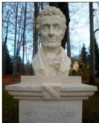
Raymannův pomník.