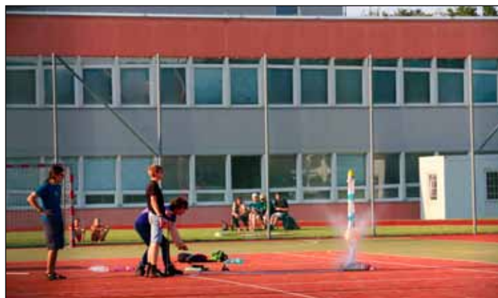
Fyzikální sekce na odpalisti vodních raket - start rakety.

Mladí badatelé se ve spolupráci s experty a svými učiteli připravovali několik týdnů v on-line učebnách, aby se v prvním srpnovém týdnu vydali do terénu Jeseníků a Rychlebských hor. Připraveny byly různě tematicky zaměřené sekce, hydrogeologové měřili radioaktivitu pramenů, botanici mapovali rozšíření invazních rostlin podél místních říček a potoků, historikové zkoumali cesty, kterými se v minulosti vydávali účastníci lidové tradice zvané „jízda osením“, fyzikové testovali vodní rakety a sekce dokumentaristů