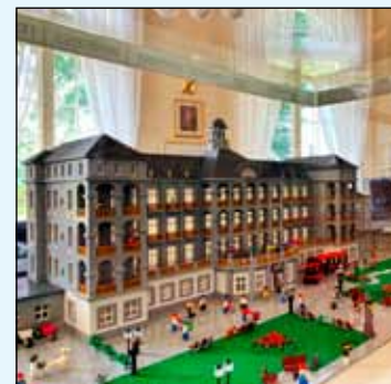
Model tvoří 63 559 kostiček.

Po třech letech v budově mošnovského letiště se do Jeseníku vrátil unikátní model hlavní lázeňské budovy, postavený ze stavebnice LEGO. Návštěvníci lázní jej mohou obdivovat v Salónku osobností, který se nachází v spojovací chodbě mezi hlavní a novou budovou sanatoria.