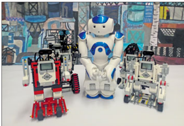
Roboti dostali nový vzhled a modernější systém.