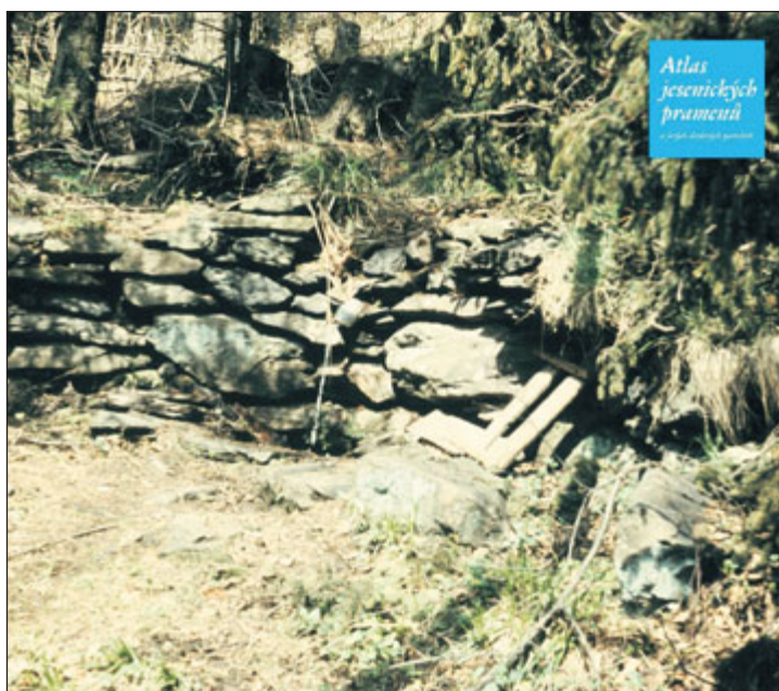
Antonínův pramen na snímku z roku 1985.

Pokud bychom pokračovali po původní stezce dále vzhůru, doj-