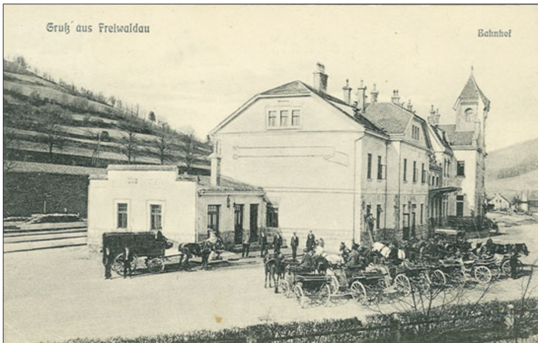
Jesenické nádraží počátkem 20. století.