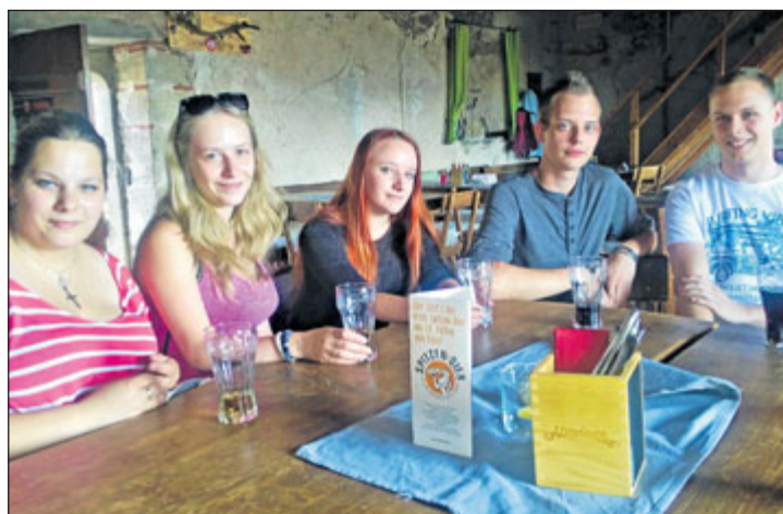
Žáci školy se vydali na zkušenou do Rakouska.