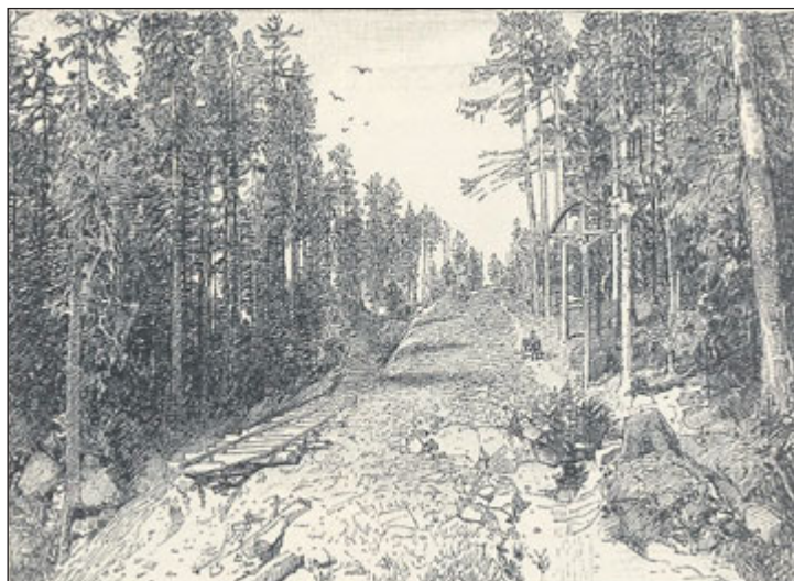
Stavba železnice do Jeseníku byla velmi náročná.