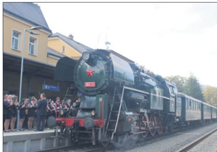
Do Jeseníku, u příležitosti 130 let železnice Hanušovice – Gluchoňazy, přijel letos v září parní vlak.