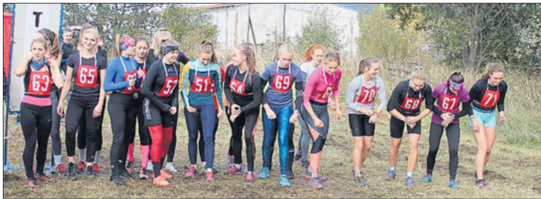
Sportovní akce se konala na běžeckých tratích Fenix-Ski Teamu v bývalých kasárnách.

V letošním roce se 10. října sešlo na krajském finále celkem 31 šestičlenných družstev chlapců a dívek z 20 škol, která dle jednotlivých věkových kategorií zdolávala tratě dlouhé od 1,5 km do 5 km. V kategorii mladších žáků 6.-7. tříd se na prvním místě umístili žáci ze