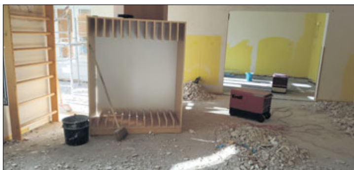
Havárie s vodou vyřadila školku z provozu na více než dva měsíce.