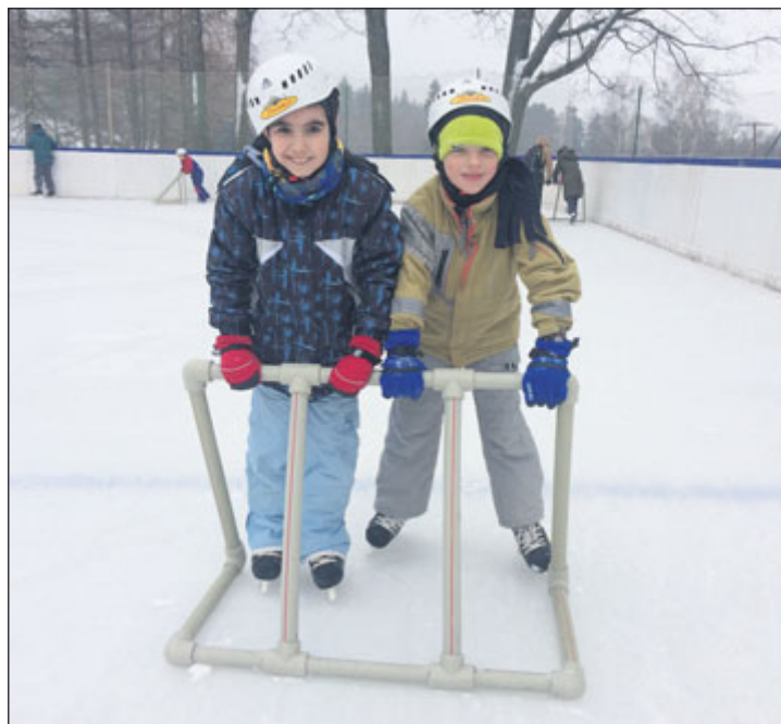
Děti mají rády pohyb na ledě.

„Kluziště se připravuje tak, aby mohlo být k 6. prosinci otevřeno. Kromě počasí závisí podmínky a především technická kvalita ledu také na naší staré rolně, která už má odslouženo mnoho a mnoho let. Může se stát, že budou nutné její průběžné technické opravy, dojde k odstávce během sezóny a nebude vždy možné zajistit dostatečně kvalitní led například pro hokejová utkání,“ vysvětluje obchodní ředitelka PLL Kateřina Tomášková s tím, že v prvé řadě se lázně snaží zajistit ledovou plochu pro rekreační bruslení veřejnosti, škol, klientů a návštěvníků lázní. „Také letos se na kluzišti uskuteční řada zábavných akcí. Děti i dospělí, návštěvníci lázní i lidé z okolí se mohou těšit například na školičky bruslení, na maškarní bal na ledě, valentýnskou diskotéku a dal-