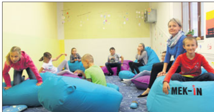
Relaxační koutek slouží dětem od konce října.