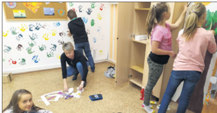
Děti se postaraly o výzdobu relaxačního koutku.