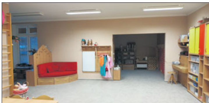
Dnes už školka opět funguje ve svém režimu.