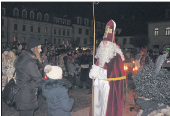
Opět po roce dorazí do Jeseníku Mikuláš s anděly a čerty.

Hned následující dva dny, 6. a 7. prosince , se centrum dění přesune k Vodní tvrzi, kde se uskuteční tradiční Vánoční jarmark. Zámecké náměstí i nádvoří tvrze nabídnou pódium, na němž se budou střídát středověké kapely, živý betlém, ukázky rozličných tradičních řemesel a především řadu stánků