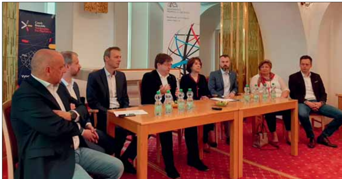
MINISTERSKÁ DELEGACE. Početná skupina zástupců ministerstva pro místní rozvoj, ministerstva průmyslu a obchodu, Inovačního centra Olomouckého kraje a další hosté zavítali v pátek 12. června do Jeseníku. S vedením radnice jednali o projektu 5G pro 5 měst, zúčastnili se tiskové konference (viz foto) a navštívili partnery zmíněného projektu. V podvečerních hodinách byli hosty besedy s veřejností věnované sítím 5. generace. Více na str. 3

Velký maďarský státník se narodil v Jeseníku | 12 |