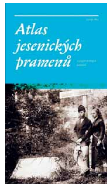
Titulní strana knihy Lukáše Abta.