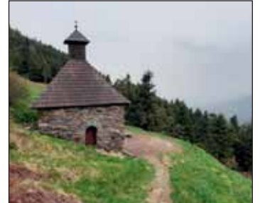
Vřesová studánka.