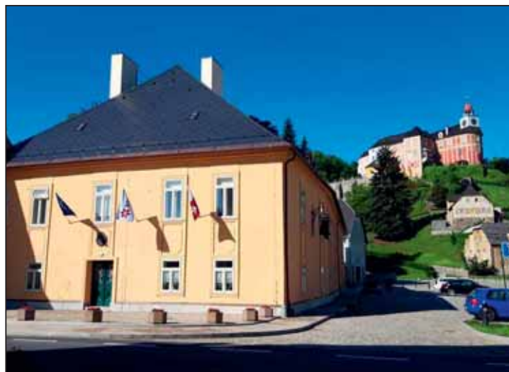
Nové „íčko“ v Javorníku.

Zvidavý turista si jistě nemohl nevšimnout, že javornické náměstí prošlo v poslední době zdařilou obnovou. Městu Javorník se mimo jiné podařilo zachránit zchátralou historickou budovu Soudu, která je dnes po náročném rekonstrukci chloubou náměstí. Budova byla slavnostně otevřena letos v červnu.