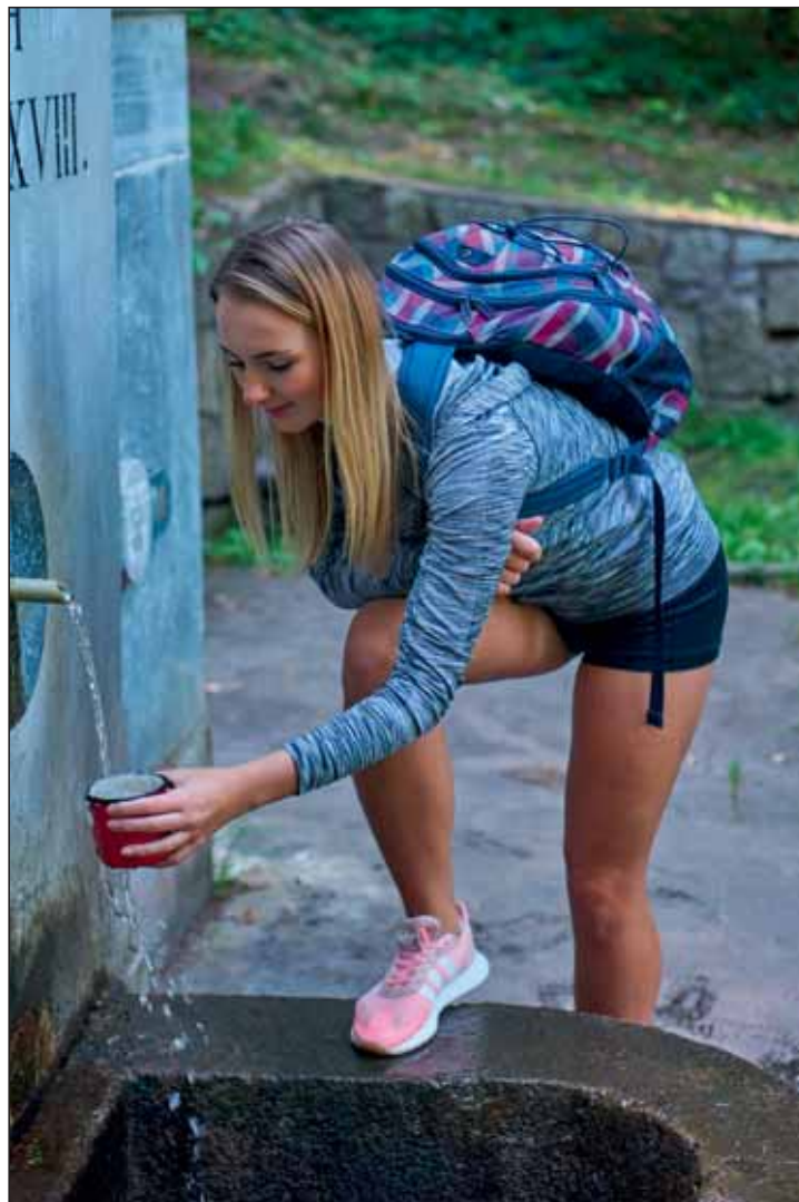
Anglický pramen ve Smetanových sadech.