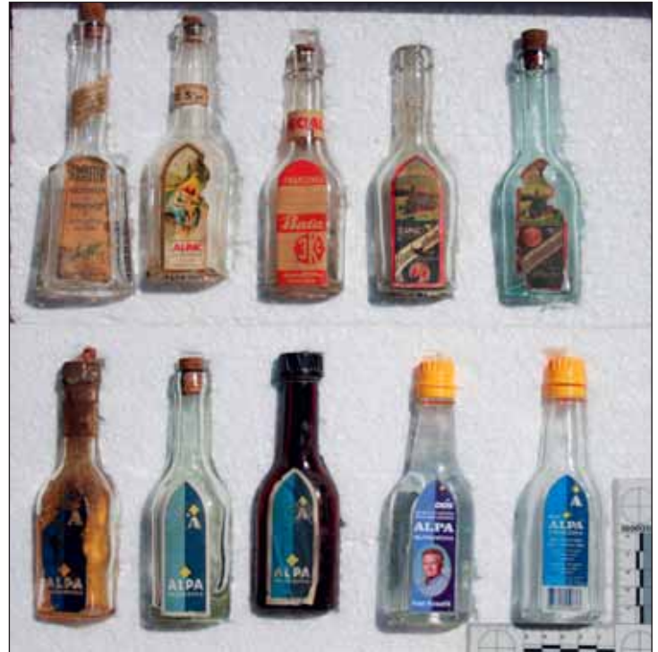
V muzeu najdeme i věci běžné potřeby, třeba lahvičky francovky.