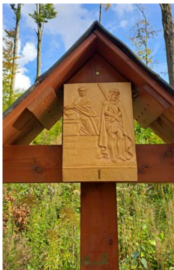
Nová podoba vyobrazení na zastavení křížové cesty.

Křížová cesta v Jeseníku vede od Anglického pramene ke kapli sv. Anny na Křížovém vrchu po