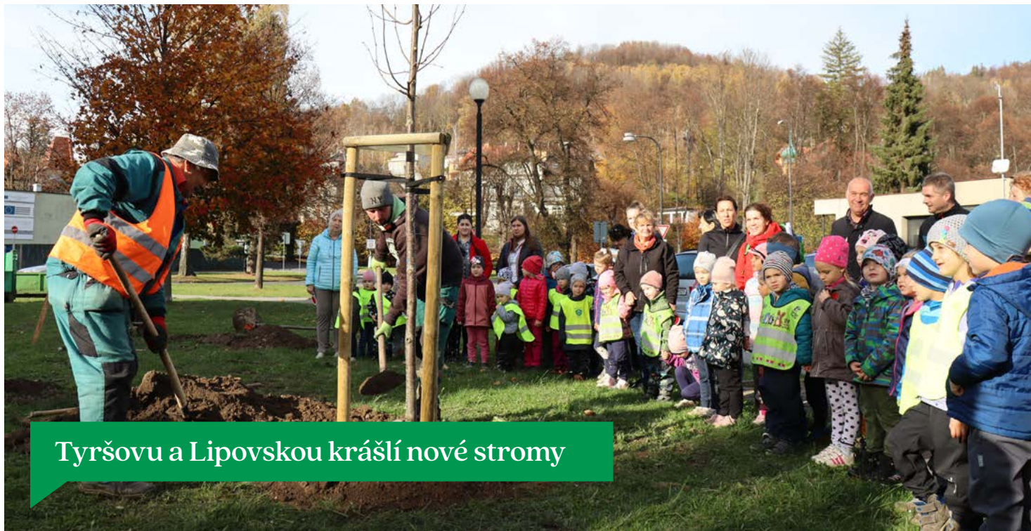
Tyršovu a Lipovskou kráší nové stromy

Děti z Materské školy Kopretina a Rada jesenických seniorů pomohly s výsadbou sedmi lip malolistých a jeřábu prostředního na zelených plochách v ulici Tyršova. Na výsadbu, která proběhla první týden v listopadu, navázal vznik lipové aleje na ulici Lipovská. Celý projekt podpořila částkou 116 000 Kč Nadace ČEZ. Lipová alej, vysázená od obchodu COOP až po křižovatku do lázni podél hlavní komunikace, vytvoří optický předěl mezi sídlištěm Lipovská a rušnou silnicí. Alej je tvořena deseti lípami malolistými, které byly vysázeny také na travnaté ploše před panelovým domem na ulici Tyršova. Nově vzniklý předěl mezi stávající parkovací plochou a bytovými domy podpoří také jeřáb prostřední. Výsadba stromů přispěje ke zlepšení vzhledu veřejného prostoru a zlepšení kvality ovzduší. Stromy hrají také významnou roli při vyrovnání teplotních extrémů v této části města.