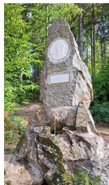
Po několika desetiletích znovu teče voda z pramene U Vousáče.

Město Jeseník na rok 2023 připravuje opravu sousosí Vincenze Priessnitzve ve Smetanových sadech, která si vyžádá výraznější zásah. Ten bude také finančně náročnější než drobné úpravy v letošním roce. Aktuálně připravujeme podklady pro tuto opravu