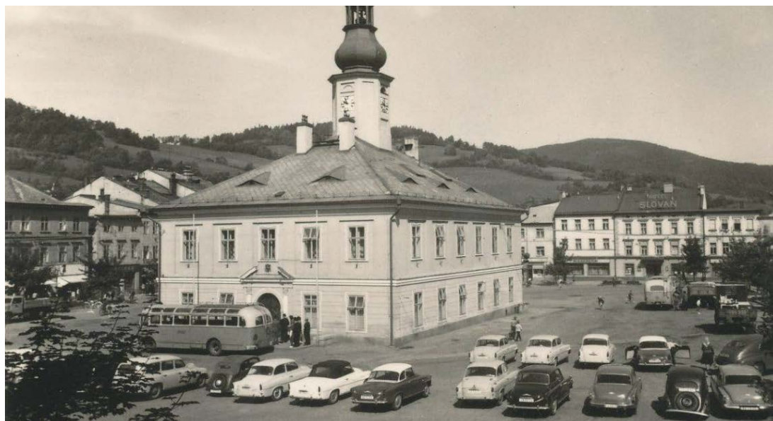
Náměstí s radnicí, pohled severním směrem k hotelu Slovan, v roce 1965.