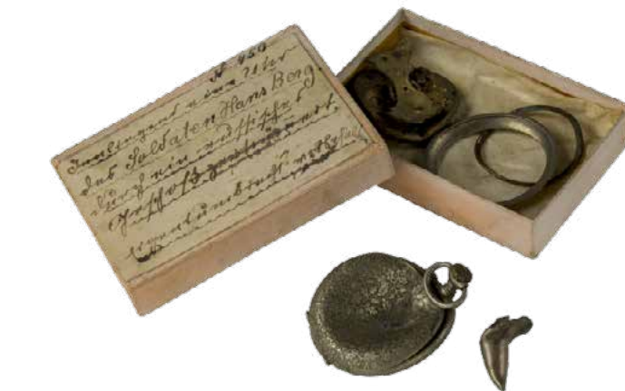
Krabička s hodinkami a projektilem.

Mít ve sbírce korespondenci samotného Ludwiga van Beethovena je pro muzejníka vzácným požehnáním. A i přesto, že se třístránkový dokument podepsaný jménem génia vážné hudby v jesenické historické sbírce skutečně nachází, bylo by namísto spíše