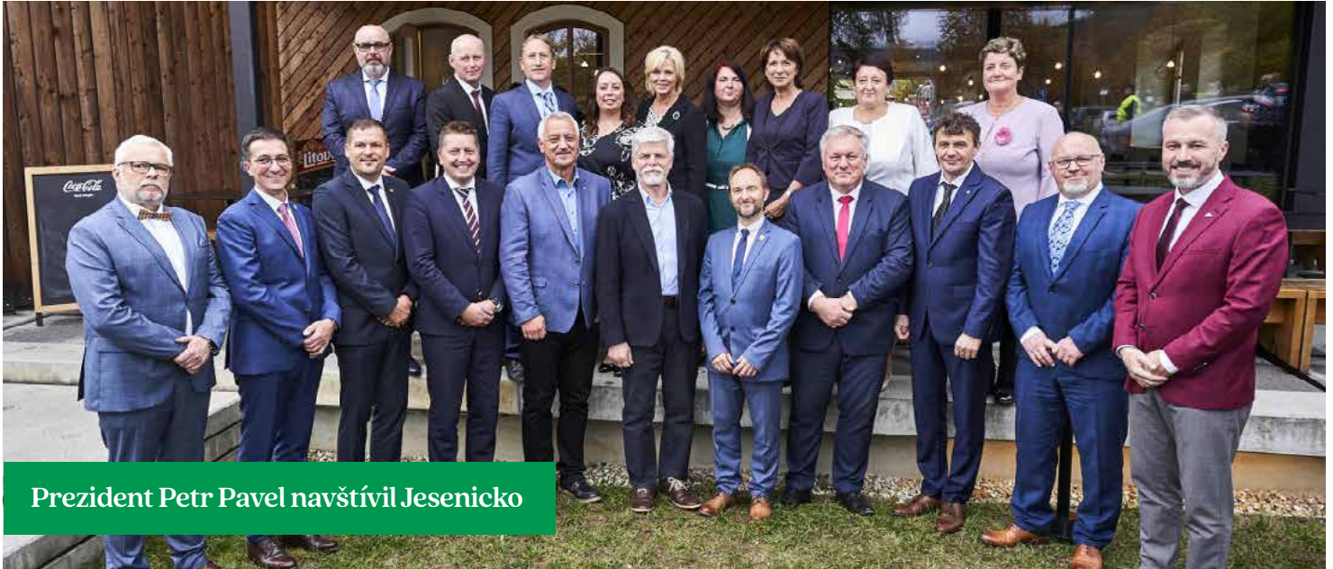
Prezident Petr Pavel navštívil Jesenicko