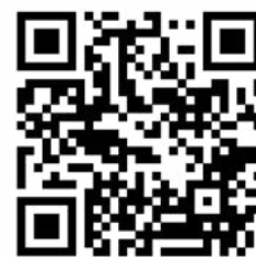
Obrazový materiál k článku po načtení QR kódu.

Informace získané z družic jsou tak nepochybně významné pro zdejší komunitu. Odhalují změny v krajiněm pokryvu, podporují plánování města a pomáhají v zemědělství. Užitečné jsou při řešení environmentálních výzev, jako jsou