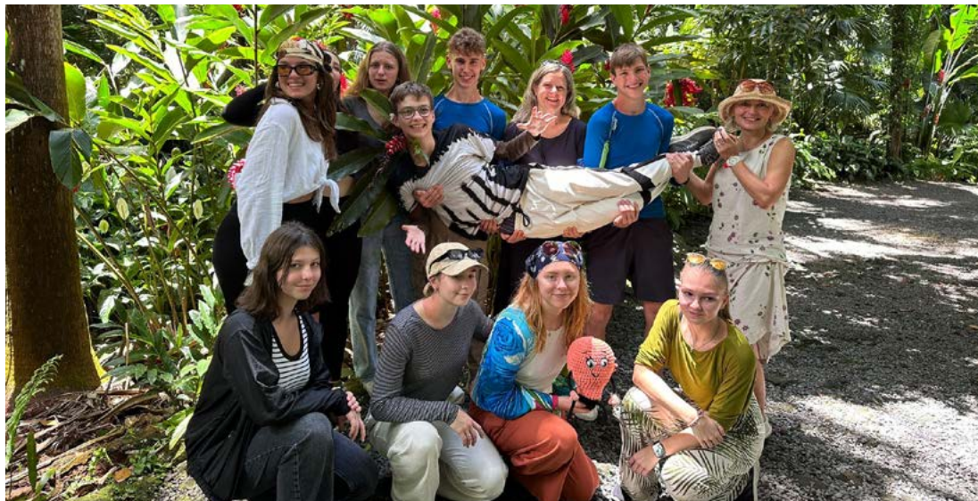
Jeseničtí studenti vyrazili na daleký Reunion.