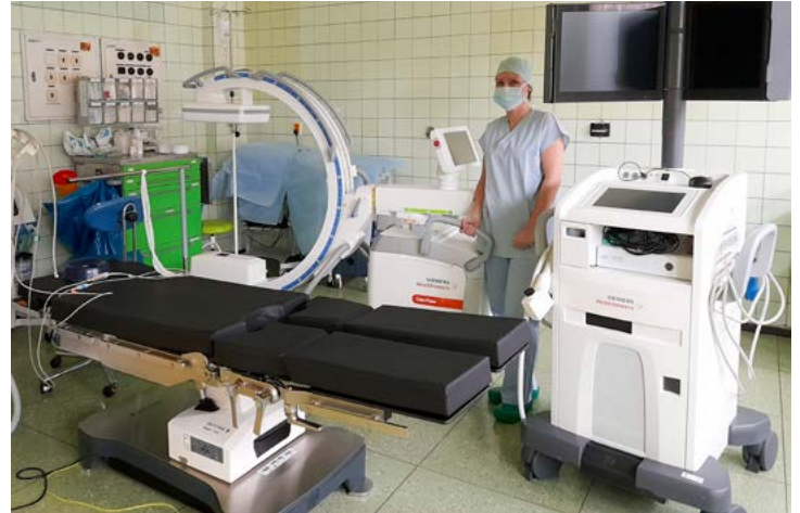
Vybavení na operačním sále.

Na diabetologické ambulanci se provádí vyšetření očního pozadí pomocí fundus kamery, která odhalí stupeň diabetického poškození zraku. „Cílem tohoto vyšetření je odfiltrování velké části pacientů, kteří nemají žádné známky takzvané retinopatie, od vyšetření u očních lékařů. Toto vyšetření se provádí u diabetologických pacientů 1. a 2. typu. Zároveň chceme tuto službu nabídnout i praktickým lékařům, kteří mají obrovské množství pacientů s diabetem 2. typu v péči. V případě prokázání retinopatie se pacient odešle na oční vyšetření. Vyšetření je jednoduché, bezbolestné, rychlé a jednou ročně plně hrazené ze zdravotního pojištění. Čekací doby jsou nyní minimální a na rozdíl od klasického vyšetření očního pozadí probíhá bez mydriázy (pozn.: rozšíření zorničky pomocí rozkapání oka). Pacient jenom přiloží hlavu ke kameře a ta