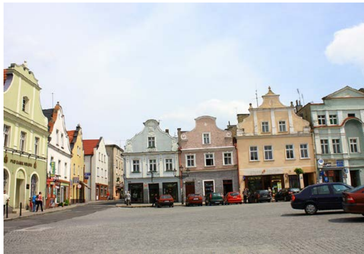
Pohled na náměstí v Głogówku.

Alena Kalinová, Odbor sociálních věcí a zdravotnictví