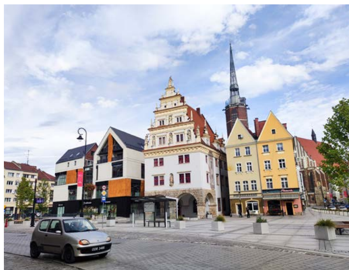
Dům městské váhy, za ním vystupuje věž radnice.