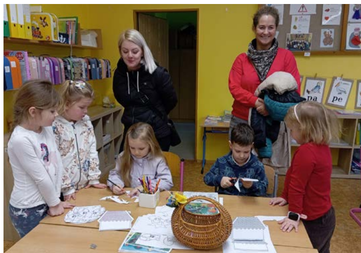
ZŠ Jeseník otevřela 20. února své brány veřejnosti.