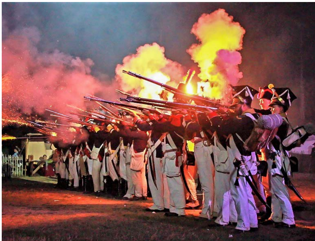
Dny pevnosti Nysa.

Tritonová kašna od Giana Berniniho ze slawoniowického mramoru symbolizuje mír a harmonii, připomíná kašnu Fontana del Tritone v Římě.