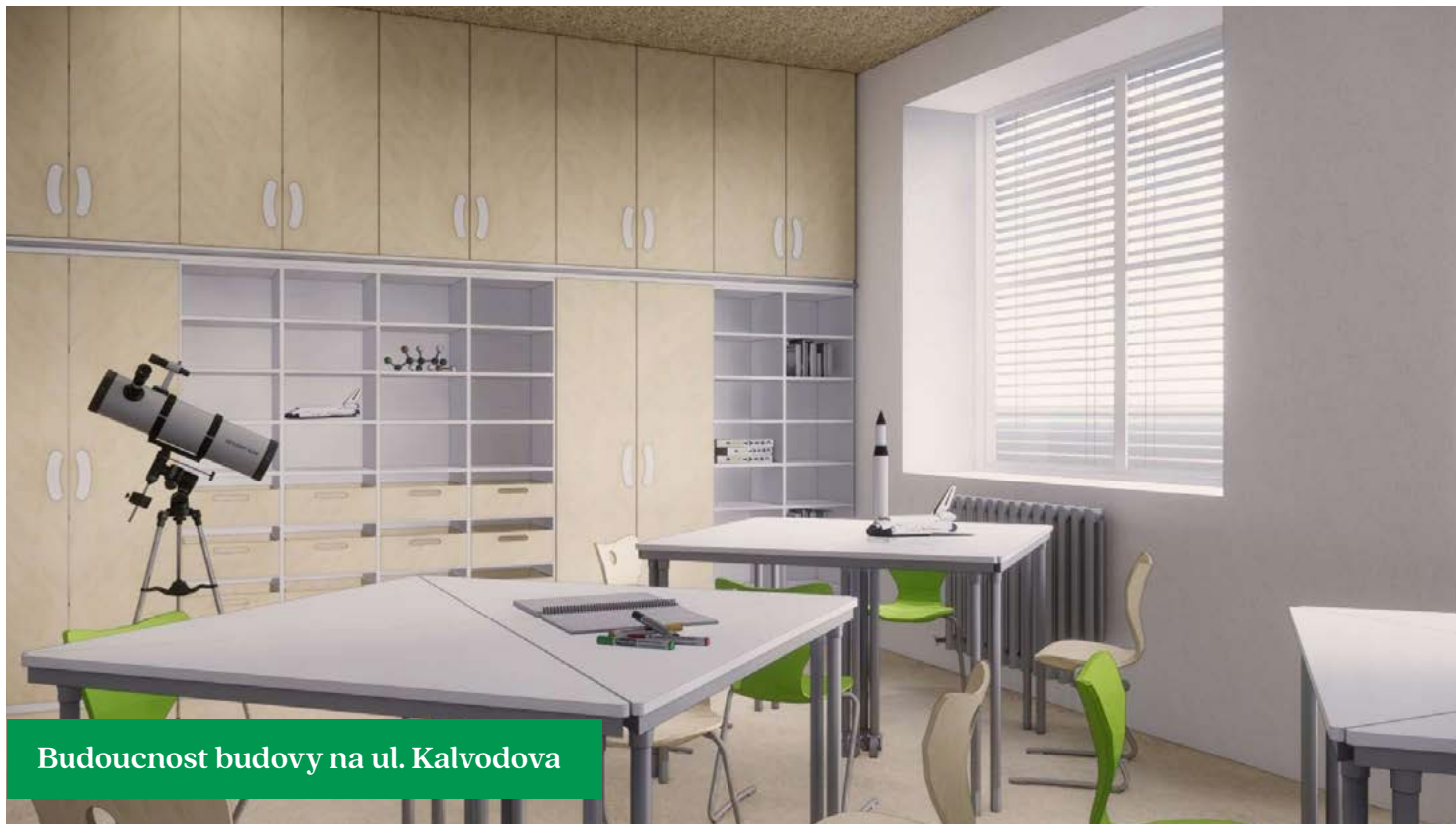
Budoucnost budovy na ul. Kalvodova