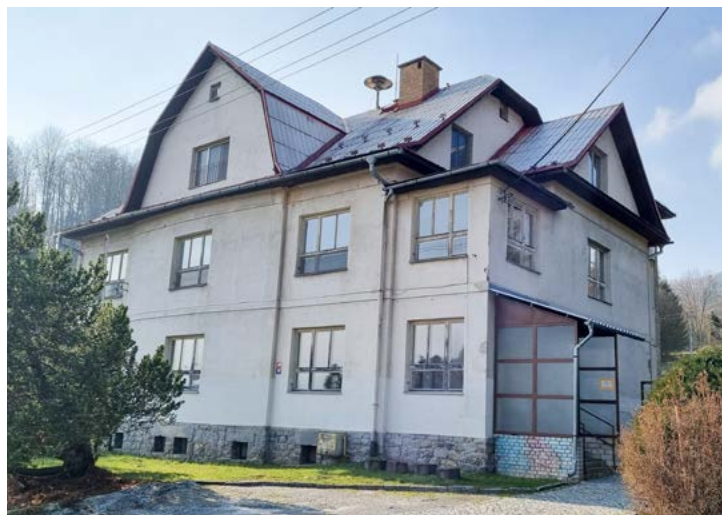
Aktuální stav budovy na ul. Kalvodova.