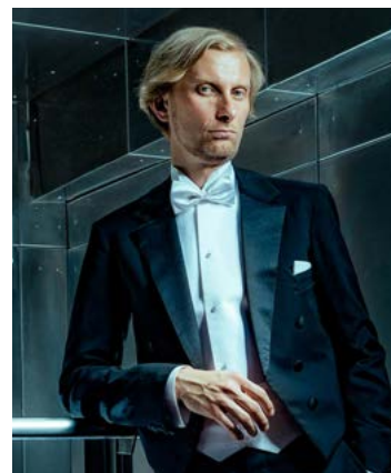
Ivo Kahánek.