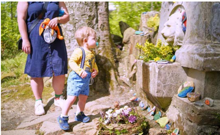
Pramen Skalka ve Smetanových sadech.

mi – NS Živé vody, NS Vincenze Priessnitze či po modré turistické značce, která vede z lázní do centra města a poté na Křížový vrch a Zlatý chlum.