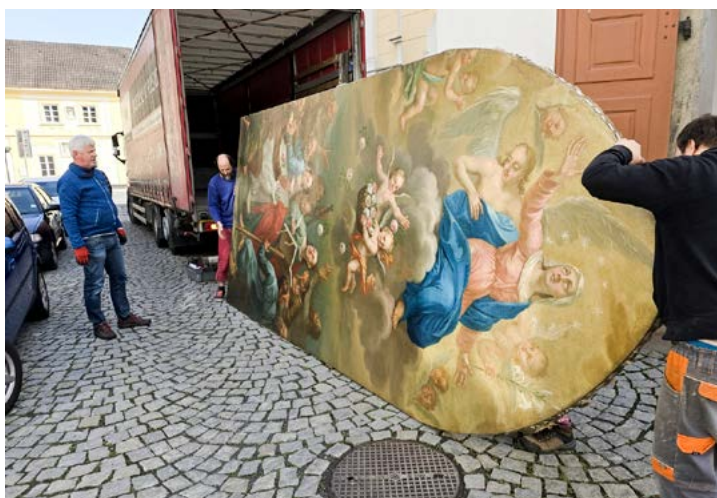
Opravený obraz z hlavního oltáře při přepravě zpět na své místo.