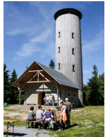
Borůvková hora.

Muzeum Vincenze Priessnitze najdete v rodném domě Vincenze Priessnitze v jesenických lázních.